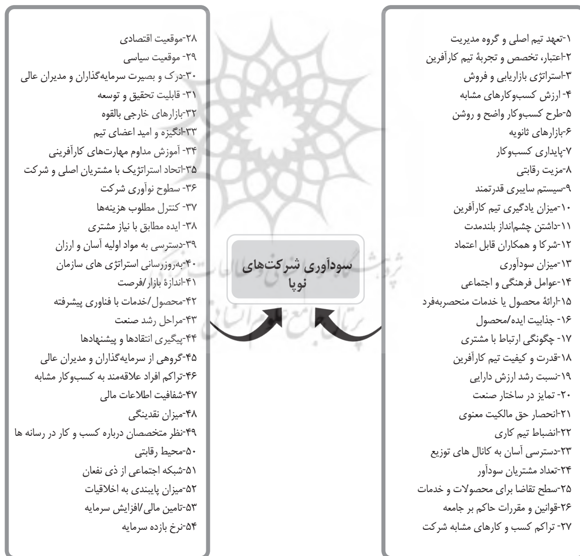
شکل ۱. مدل مفهومی احصاشده از ادبیات پژوهش

سیئونگ و کیم (۲۰۲۱) در تحقیق خود به بررسی عوامل حیاتی مؤثر بر سرمایه‌گذاری‌های سرمایه‌گذار خطرپذیر و تصمیم در مورد شرکت‌های نوپای نوآورانه که در سودآوری موفق عمل کردند، می‌پردازد. وی این عوامل حیاتی را به صورت زیر طبقه‌بندی کرده است: الف- کارآفرین شامل زیرمجموعه مدیریت/ توانایی عملکرد، تجربه و تخصص/ حرفه‌ای بودن، وضعیت کارآفرین، قابلیت اطمینان، ب- محصول/ خدمات شامل: مزیت فنی، نوآوری، ارزش کالا و همبستگی یا بخش سرمایه‌گذاری شده، ج- بازار شامل: تهدید رقیب، توجه به قوانین و مقررات، اندازه بازار، رشد بازار و امکان ایجاد بازارهای جدید، د- بخش مالی شامل زیرمجموعه ارزش شرکتی، میزان