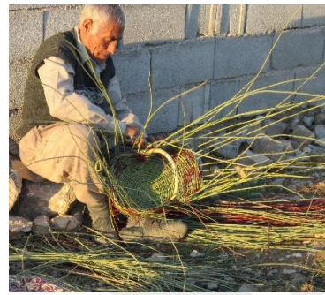
شکل ۷. سبدياف ساکن استان کهگیلویه و بویراحمد.