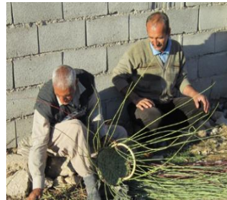
شکل ۱۰. بافنده سبد، استان کهگیلویه و بویراحمد. مأخذ: نگارندگان)