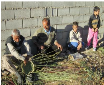
شکل ۱۱. بافنده سبد، استان کهگیلویه و بویراحمد.

این هنر که در فراموشی آن تأثیر دارد، بحث آموزش سبديافی است. در این قسمت از پژوهش وضعیت مطلوب و وضعیت موجود مقوله آموزش در هنر سبديافی استان مورد مطالعه قرار گرفته است.