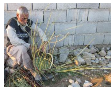
شکل ۹. بافنده سبد، استان کهگیلویه و بویراحمد.