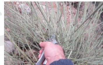
شکل ۲. بریدن شاخه‌های درختچه بادام کوهی جهت ساخت سید.