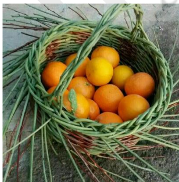
شکل ۶ کاربرد سبذ به عنوان سبذ میوه.

این قسمت در سه بخش تنظیم شده است. ابتدا بر اساس فرآیند آسیب‌شناسی، به مطالعه وضعیت موجود و مطلوب سبذبافی در استان کهگیلویه و بویراحمد در حوزه مقوله‌های کاربرد، اقتصاد و آموزش پرداخته شده و سپس آسیب‌های مربوط به این هنر