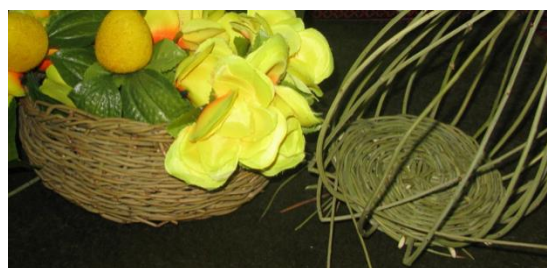
شکل ۵ کاربرد سبذ به عنوان گلدان.