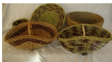
شکل ۴. انواع سیدهای بافته شده در استان کهگیلویه و بویراحمد.

سید، ظرفی دست‌بافت است که به شیوه سنتی از مواد نیمه‌سخت، مانند ترکه‌های تر و نازک درختان یا از نی‌های باتلاقی برای نگهداری و حمل میوه و هر نوع شیء جامد تهیه می‌شود. در فرهنگ لغت معین سید ظرفی بافته شده از شاخه‌های نازک درخت که در آن میوه، سبزی و غیره گذارند معرفی شده است (Moin, 2007, p. 826). در سیدبافی استان کهگیلویه و بویراحمد از ترکه های بادام کوهی (شکل ۲)، به روش در هم بافته یا مشبک، معمولاً به شیوه تار و پود عمود بر یکدیگر (شکل ۳)، محصولات مختلفی تولید می‌شود (شکل ۴)، که دارای کاربردهای متنوعی هستند.