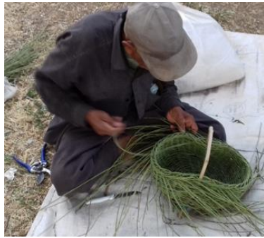
شکل ۸. سبدياف ساکن استان کهگیلویه و بویراحمد.

و ارزش احساسی است. ارزش کارکردی برگرفته از سودمندی و کارایی کالا و منعکس کننده الگوی فکری فرآیند اطلاعاتی در رفتار مصرف کننده است. ارزش احساسی ناشی از تجربه خرید و بیان کننده ارزش روانی و احساسی خرید و شامل لذت یا هیجان خرید است و جنبه شخصی تر و ذهنی تر دارد (Khalili and Montazer Ghaem, 2016, pp. 169-170). اکثر تولیدکنندگان سبدهای بافته شده در استان کهگیلویه و بویراحمد، ساکنین روستاها، با درآمد اقتصادی پایین هستند (شکل های ۷ و ۸). بر اساس رابطه هنر و اقتصاد، ایجاد شرایط مناسب برای عرضه تولید و رساندن آن ها به دست مصرف کننده می تواند بر درآمد اقتصادی آن ها تأثیر مثبت داشته باشد.