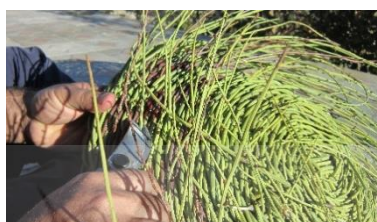
شکل ۳. از مراحل آماده‌سازی سیدهای دستباف.