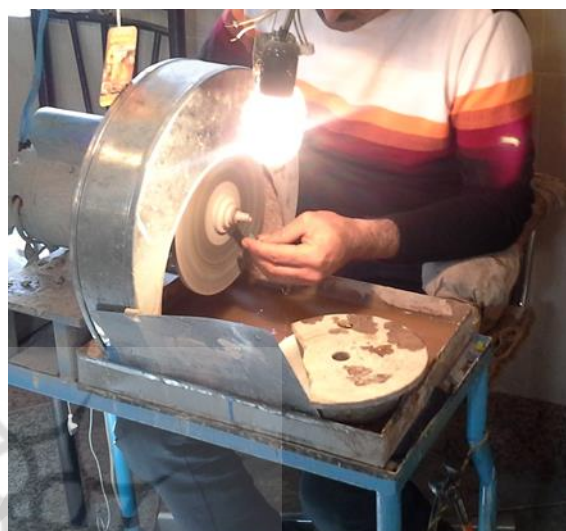
شکل ۲: دستگاه تراش کاری فیروزه (نگارندگان، ۱۴۰۰) Fig. 2: Turquoise lathe (Authors, 2021)