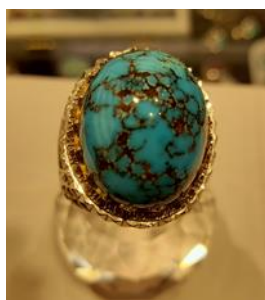
شکل ۴: انگشتر فیروزه شجری (نگارندگان، ۱۴۰۰). Fig. 4: Turquoise Shajari ring (Authors, 2021)

ت- فیروزه چغاله ( چغاله میوه نارس) فیروزه‌هائی که پوست سفید دارند چغاله خوانده می‌شوند و فیروزه‌های سبز که آن را گل کاسنی نامند (Geraioli, 1996: 561). در شکل (۴) انگشتر فیروزه شجری مشاهده می‌شود.