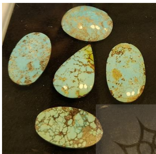
شکل ۳: فیروزه تراش داده شده (نگارندگان، ۱۴۰۰) Fig. 3: Carved turquoise (Authors, 2021)

در گذشته فیروزه را به دو طریق استخراج می‌کردند. نخست سنگ‌های معدن را با باروت منفجر کرده و فیروزه را به دست می‌آوردند، و دیگر آن‌که در رسوبات دامنه زیرین معادن کاوش می‌کردند، شستن سنگ‌های فیروزه تا چند سال قبل کاملاً به طرز بدوی بود. سنگ‌های فیروزه را در حوضچه‌ای قرار می‌دادند و آب از روی آن عبور می‌کرد. پس از این‌که رطوبت دیده و کمی سست شد کارگران سنگ‌ها را با دست شستشو داده تا فیروزه از خاک و سنگ جدا شود (Geraioli, 1996: 556). در شکل ۲ هنر تراش کاری فیروزه و در شکل ۳ سنگ فیروزه تراش داده شده مشاهده می‌شود.