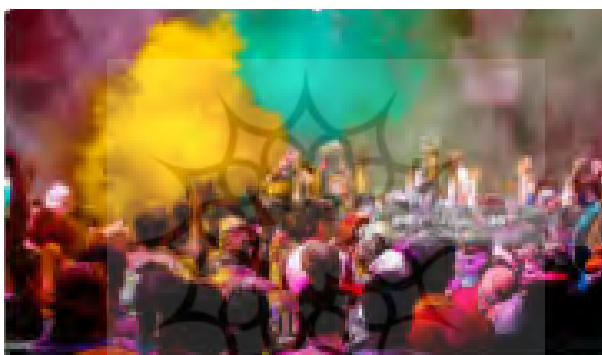
تصویر ۲. سُنْت هولی ۲ (جشن رنگ در کشور هند)