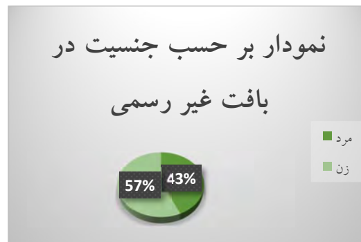
نمودار ۳- رمزگردانی بر حسب جنسیت بر اساس بافت غیررسمی پاسخ‌دهندگان

جدول (۴) اطلاعات توصیفی مربوط به میزان رمزگردانی براساس سن افراد نمونه است که در هر دو بافت مورد بررسی قرار می‌گیرد. دامنه سنی افراد نمونه بین ۷ تا ۱۳ سال تا بیشتر از ۵۰ سال می‌باشد. همان‌گونه که جدول نشان می‌دهد کمترین درصد رمزگردانی به زبان فارسی مربوط به گروه سنی بیشتر از ۵۰ سال (۱۶ درصد) و بیشترین درصد رمزگردانی به گروه ۷ تا ۱۳ سال (۴۵ درصد) اختصاص دارد.