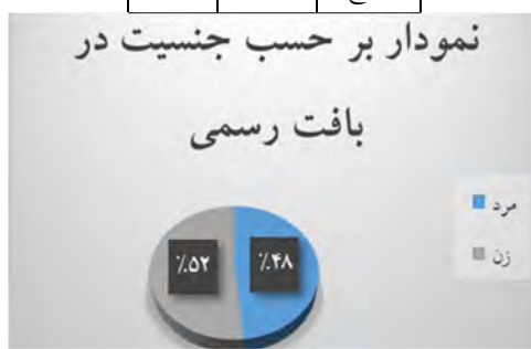
نمودار ۲- رمزگردانی بر حسب جنسیت بر اساس بافت رسمی پاسخ‌دهندگان

جدول (۳) اطلاعات توصیفی مربوط به میزان رمزگردانی را بر اساس جنسیت افراد نمونه در بافت غیررسمی نشان می‌دهد. جدول ذیل نشان می‌دهد بیشترین رمزگردانی به زبان فارسی در بافت غیررسمی در بین زنان (۵۷ درصد) و کمترین میزان مربوط به جنسیت مرد (۴۳ درصد) می‌باشد.