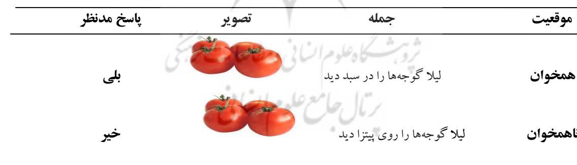
Table 1- Examples of stimuli in Perceptual Simulation task