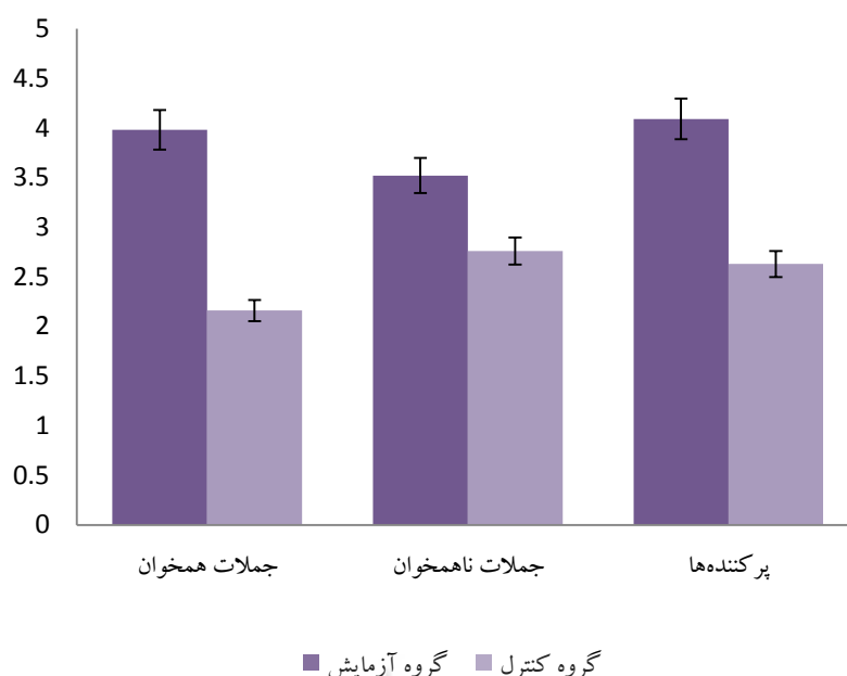
نمودار ۱- میانگین مدت زمان پاسخ‌گویی به جملات همخوان، ناهمخوان و پرکننده‌ها Diagram 1- Mean of response times (RTs) in the match, mismatch and filler conditions