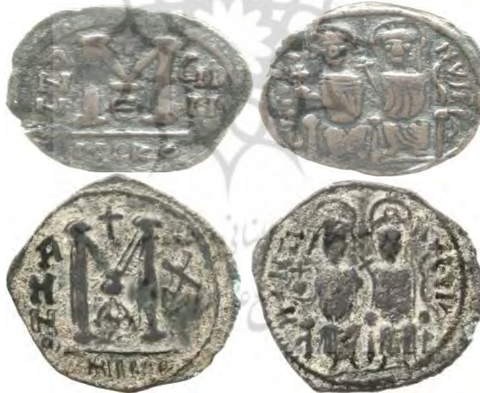
سکه تقلیدی، تصویر یوستین و همسرش سوفیا را دارد (Pottier, and Foss, 2004: 287)

نمونه‌ای از سکه‌های برنزی که در زمان فرمانروایی ساسانیان در سوریه ضرب شده است.