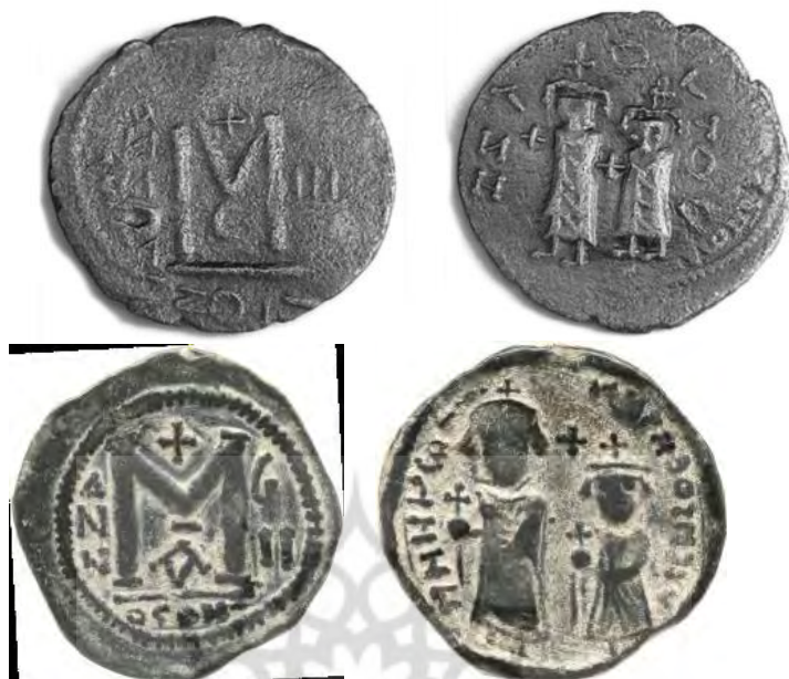
سکه تقلیدی، تصویر هراکلیوس و پسرش کنستانتیوس را دارد (Pottier, 2010: 468; Pottier, and Foss, 2004: 282)