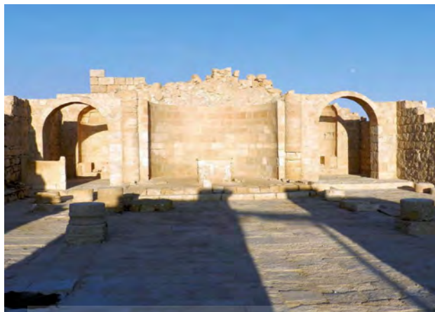
صحنه هاجیوس تنودوروس (Hagios Theodoros) که در آوادات/اوبودا در ۶۱۷ م کنده شده است. (Reynolds, 2013: 124)

فصلنامه علمی تاریخ اسلام و ایران دانشگاه الزهراء(س)، سال ۳۲، شماره ۵۳، بهار ۱۴۰۱ / ۵۱