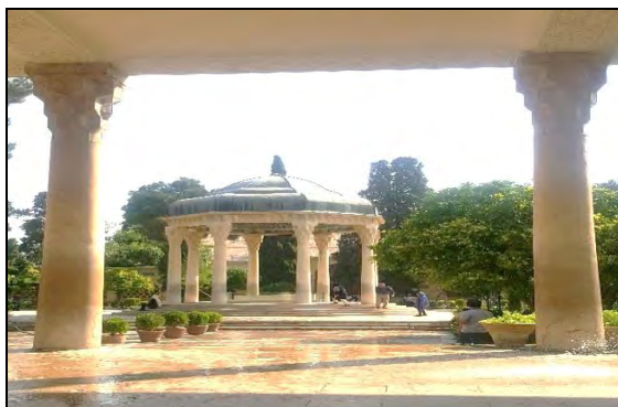
عکس شماره ۳: مقبره حافظ شیرازی