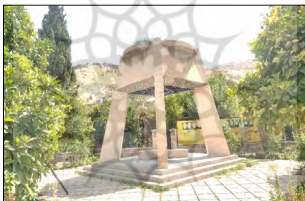
عکس ۳: آرامگاه شاه شجاع مظفری، شیراز، هفت تنان.