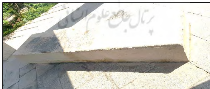
عکس ۴: نمای سنگ قبر شاه شجاع مظفری.