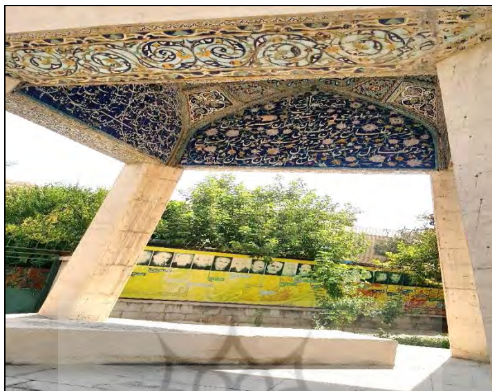
عکس ۵: نمای داخلی بقعه شاه شجاع مظفری.