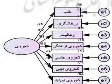
شکل ۲. تحلیل عاملی مرتبه دوم ابزار سنجش کجروی نوجوانان دختر در حالت ضرایب استاندارد

پژوهشگاه علوم انسانی و مطالعات فرهنگی رشته جامعه‌شناسی