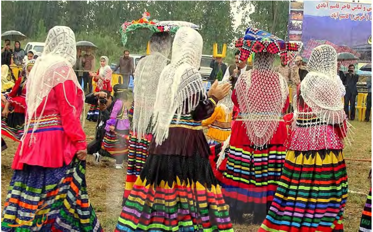
تصویر ۲. پوشاک زنان شمال ایران.