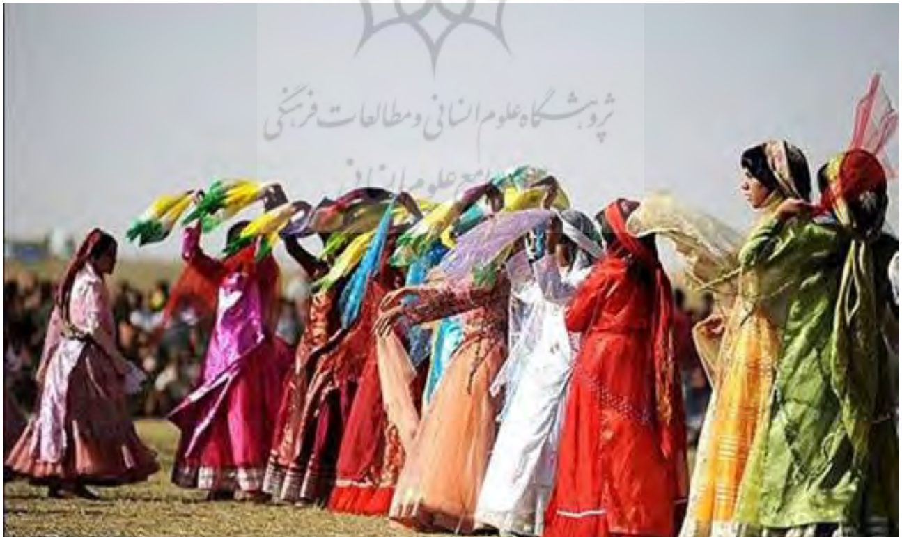
تصویر ۳. پوشاک زنان قشقای.