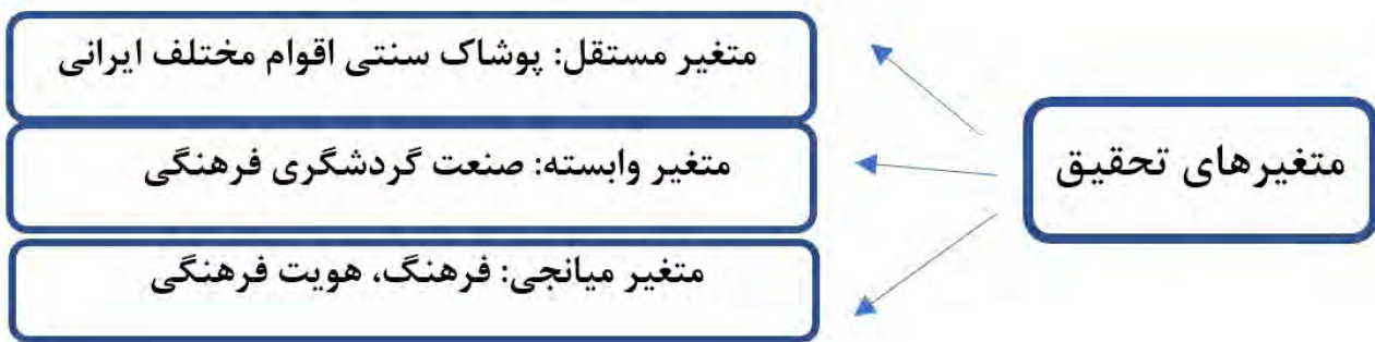
تصویر ۴. مدل مفهومی (متغیرهای تحقیق).

به علت استفاده از منسوجات مصنوعی و بی کیفیت و ارزان، ارزش واقعی خود را کمرنگ کرده‌اند. کیفیت پایین و نامرغوب بودن، لطمه بزرگی به اصالت و هویت فرهنگی پوشاک سنتی می‌زند. از این رو آگاه‌سازی و آموزش‌های تخصصی کمک شایانی به اشاعه فرهنگ اصیل بومی می‌کند (جدول ۱).