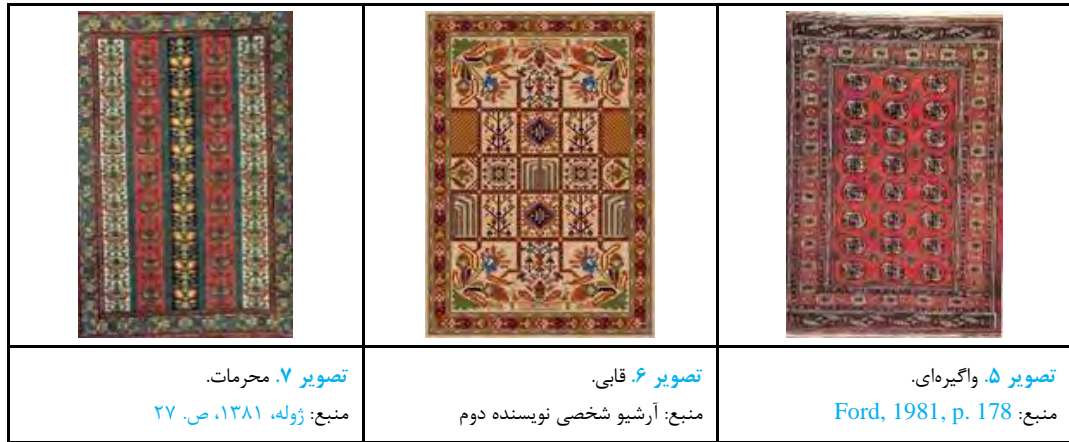
جدول ۳. نقوش متداول در قالی دست‌بافت.