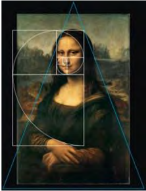
تصویر ۱۴. تجزیه و تحلیل تابلوی