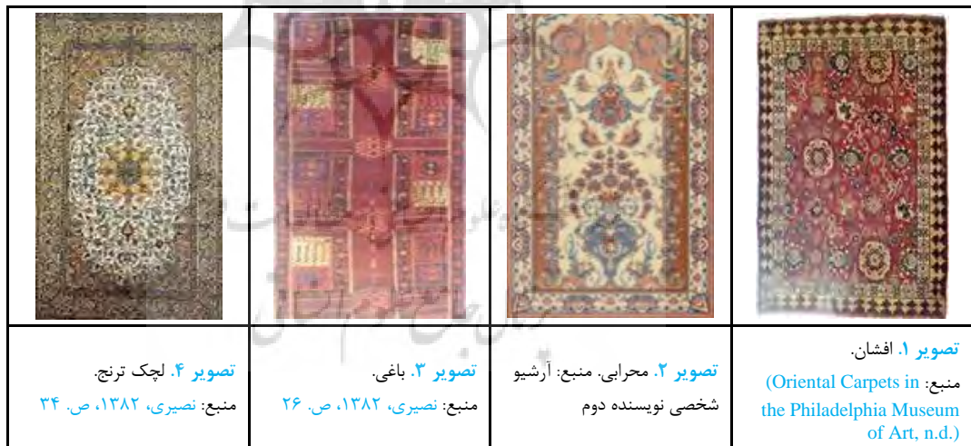
جدول ۲. طرح‌های متداول قالی ایران.

دارند (اربابی، ۱۳۸۷، ص. ۶۴). طرح و نقش قالی‌های تولیدشده در مناطق مختلف جغرافیای بافندگی قالی ایران، می‌توانند به صورت عشایری (کاملاً تجریدی و هندسی)، روستایی (نیمه‌هندسی و با جزئیات بیشتر) و شهری (گردان و پرجزیات) باشند که همگی در چارچوب‌های طبقه‌بندی شده منظم و مشخص قرار می‌گیرند. از پرکاربردترین تعاریف ارائه شده در مورد طبقه‌بندی طرح و نقش، طبقه‌بندی نوزده‌گانه شرکت سهامی فرش ایران است که با توجه به دارا نبودن ساختار مناسب در تعاریف، قابلیت کاربردی خود را از دست داده است و طبقه‌بندی نادرست و مخدوش به نظر می‌رسد؛ افزون بر این، تفاوت‌هایی که در تعریف طرح و نقش وجود دارد، این اشکالات را به درستی نشان می‌دهد که برای ارزیابی طرح و نقش، نخست، باید ساختار کلی نقوش یا شکل کلی و معماری نقوش آن ساختار را با عنوان طرح معرفی نمود و چنانچه نقوش طرح دارای موضوعی باشند آن را در ادامه افزود. در سایر موارد چون اسلوب طراحی ۲۰ و نوع نقشه ترسیمی ۲۱ جهت تکمیل نمودن معرفی یک قالی صورت می‌پذیرد و تأثیری بر طبقه‌بندی انواع طرح قالی‌ها ندارد؛ از این رو اساس طبقه‌بندی ارائه شده ۲۲ بر دو محور طرح و نقش استوار است. طرح قالی‌ها را می‌توان در هفت عنوان کلی معرفی نمود؛ محرمات، قابی، واگیره‌ای، لچک ترنج، باغی، محرابی و افشان (جدول ۲)؛ همچنین نقوش قالی‌ها شامل نقش‌های ختایی، اسلیمی و تلفیقی از هردو (اسلیمی ختایی) ۲۳ و نقش‌مایه بته، انواع درختان، گلدان، دسته گلی، جانوران (حیوانات، پرنده‌های طبیعی و افسانه‌ای و ماهی)، قندیل، اشیای زیرخاکی، مناظر و تصاویر، گل‌فرنگ و ... هستند جدول ۳ که با توجه به تعداد پرشمار و تنوع بسیار، صرفاً به تعدادی از آنان اشاره شده است (عیقزلو و زاویه، ۱۳۹۹، ص. ۱۶۴).