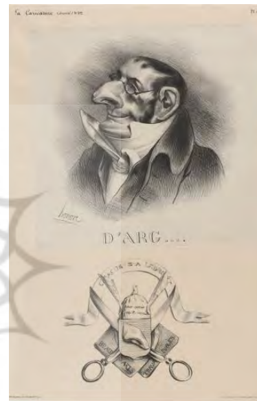
تصویر ۱۴. کاریکاتور فیزیوگنومیک کنت آرگو با چهره و دماغ عقابی: انوره دومیه، لا کاریکاتور، ۱۸۳۲، لیتوگرافی (گالری ملی هنر، واشینگتون) (URL15).

ماسک‌های ۱۸۳۱، از شاهکارهای فیزیوگنومی دومیه است که در آن چهره ۱۵ فرد را با شخصیت‌ها درونی آنها به نمایش گذاشته است (تصویر ۱۶). گلابی رسیده در وسط این لیتوگرافی نماد شاه است. در اطراف او چهارده نقاب به