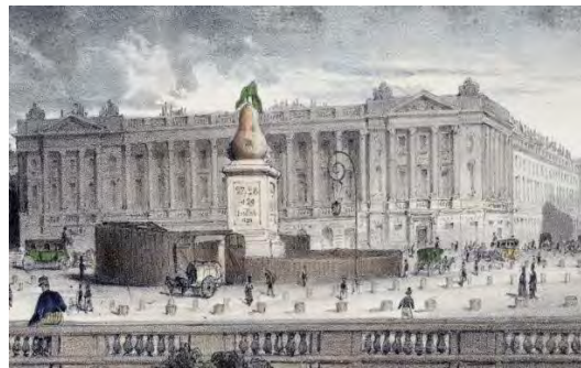
تصویر ۱. پروژه بنای یادبودی تاریخی به شکل گلابی بزرگ که باید در میدان انقلاب نصب شود، دقیقاً در مکانی که گردن لویی شانزدهم با گیوتین زده شده بود. شارل فیلیپون، لا کاریکاتور، ۱۸۳۲، چاپ لیتوگرافی، ۲۹/۶×۲۱/۸cm، (خانه بالزاک، پاریس) (URL13).

با اختلال روانی، چنین کارتونها و کاریکاتورهایی را برای تمسخر شاه می‌کشد. همکار کاریکاتوریست فیلیپون، یعنی دومیه که کارهای گزنده و هجوآمیز او در اوایل سال ۱۸۳۰