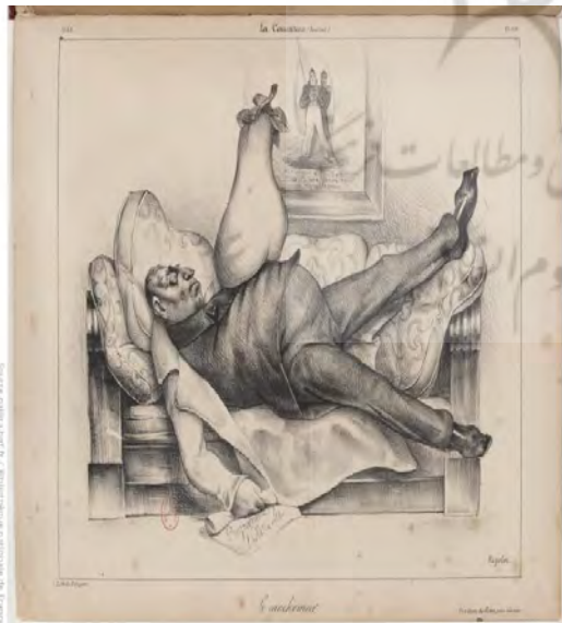
تصویر ۱۲. کابوس: هنری فوزلی، ۱۷۸۱، رنگ روغن روی بوم، ۱۲۷x۱۰cm (مؤسسه هنر دیترویت، دیترویت، میشیگان) (URL6).

اینکوبوس کرده و او را دعوت به خود می‌کند.