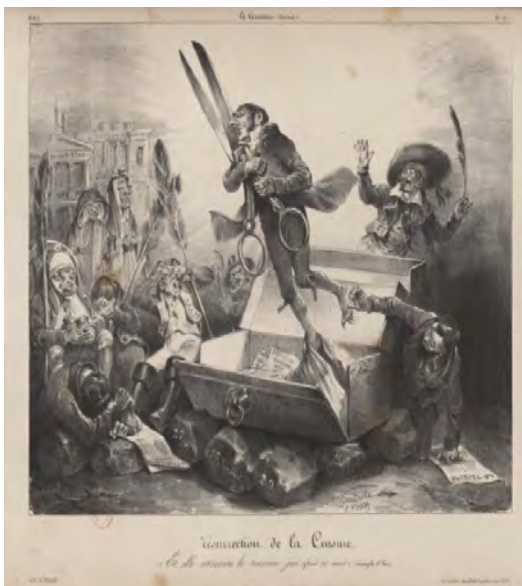
تصویر ۱۳. رستاخیز سانسور که ۳ روز پس از مرگ دوباره برخاست: انجیل مقدس لوقا، گراندویل و اوزن فورست، لیتوگرافی، لا کاریکاتور، ۵ ژانویه ۱۸۳۲، لوح ۱۲۵ (کتابخانه ملی فرانسه، پاریس) (URL8).

صحنه، تقلیدی مسخره‌آمیز از رستاخیز مسیح است. کنت دارگو از درون تابوت مطبوعات به بیرون پرواز می‌کند در حالی که عاشقانه قیچی بزرگ سانسور را در آغوش گرفته است. ناخن‌های پای او همانند عقاب، پرنده شکاری است که با دماغ عقابی اغراق شده‌اش او هماهنگ است. تابوت روی سنگ‌هایی قرار دارد که تاریخ‌های ۲۷ و ۲۸ و ۲۹ ژوئیه روی آنها حک شده است، سه روز شکوهمند انقلاب ژوئیه. در سمت چپ، چهار مرد از حال رفته، در حال خمیازه و خوابیده، نماد مطبوعات هستند، زیر بغل سه نفر از آنها قلم‌های پر بزرگ، تمثیلی از نوشتن، قرار دارد. یکی از آنها کلاه شبی بر سر دارد که روی آن عبارت «Constitutionnel» (روزنامه رسمی دولت) نوشته شده است. شخص دیگری در سمت راست نیز قلم پر نسبتاً بزرگی در دست دارد و به آرگو با تعجب می‌نگرد. در پایین سمت راست نیز مردی روی زمین در حال بلند شدن، دست راست خود را به سمت پای کنت برده و دست چپ خود را به صورت حایل برای برخاستن روی روزنامه لاتریبون گذاشته است.