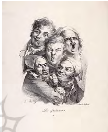
تصویر ۱۷. حالات بیانی چهره: لویی لئوپولد بویلی، از مجموعه گریماس (The Grimaces)، ۱۸۲۳-۱۸۲۸، ۲۵/۴ × ۳۳/۴ cm، کلکسیون الیشا ویتلسی (Elisha Whittelsey Collection) (موزه هنر متروپولیتن) (URL12).

«ناشر دومیه، چارلز فیلیپون با چاپ چنین کارتونی‌هایی، با در نظر گرفتن بخشی از درآمد نشریه انجمن ماهیانه ۱۶ هزینه