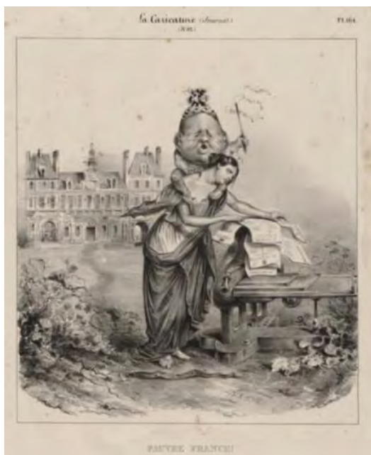
تصویر ۸. «فرانسۀ بیچاره»: چاپ سنگی، اوژن فورست، ۲۴ می ۱۸۳۲، منتشر شده در لاکاریکاتور، شماره ۸۲، لوح ۱۸۴ (کتابخانه ملی فرانسه، پاریس) (URL3).