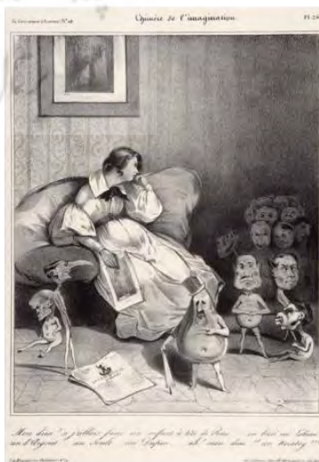
تصویر ۱۵. کیمرایی از تصور: انوره دومیه، ۷ فوریه ۱۸۳۳، لیتوگرافی، منتشر شده در لا کاریکاتور، شماره ۱۱۸، ۳۴/۴ × ۲۶/۴ cm (موزه هنر متروپولیتن) (URL12).

نماینده‌ای از اعضای مجلس قانون‌گذاری وجود دارد. به دلیل خطر اتهام و جرم برای کشیدن کاریکاتور شخص پادشاه، کاریکاتوریست‌ها مجبور شدند هنگام کشیدن او به عنوان گلابی، ویژگی‌های لویی فیلیپ را تار یا مخدوش کنند. چهره این نمایندگان را می‌توان در لیتوگرافی دیگری با عنوان «شکم قانون‌گذار» یافت. برای دومین بار در لیتوگرافی ماسک‌های ۱۸۳۱، نام مستعار دومیه، یعنی «روژن» ظاهر می‌شود (South, 1991: 92).