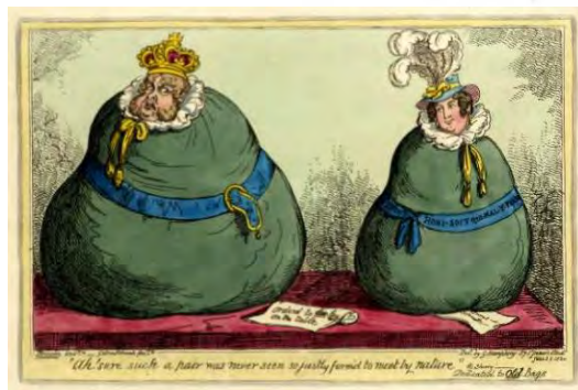
تصویر ۳. جورج چهارم (۱۷۶۲-۱۸۳۰) و ملکه کارولین در لباس‌های کیسه‌مانند به شکل گلابی: جورج کرویکشانک، ۲۳ ژوئن ۱۸۲۰، تکنیک اچینگ و رنگ آمیزی دستی، ۳۹/۲×۲۵/۸cm، (موزه هنر هامبورگ) (URL1).

چارلز فیلیپون نمایش بی‌رحمانه لویی فیلیپ را که به مثابه یک گلابی بسیار ناخوشایند جلوه می‌کرد، در سال ۱۸۳۱ آغاز کرد. وی به عنوان دفاع، در دادگاهی که وی را به نقض حیثیت پادشاه متهم کرده بود، طراحی چهره‌هایی را انجام داد که نشان می‌داد چگونه سر پادشاه در یک روند تحولی و در چند مرحله چرخش می‌کند و به شکل گلابی نزدیک می‌شود. این اثر یکی از تأثیرگذارترین کاریکاتورهای فیزیوگنومیک ۱ سیاسی بود که شخصیت پادشاه را از دید فیلیپون نمایش می‌داد (تصویر ۴). او بعداً طرح اولیه را در لا کاریکاتور منتشر کرد. «از آن زمان به بعد، شاه در مجلات لیبرال فرانسه بی‌وقفه شبیه گلابی و سپس دقیقاً مثل خود میوه تصویر می‌شد. این تشبیه در بسیاری از سطوح کارساز بود: غنچه‌های بزرگ و فرم بدن لویی فیلیپ به او این شکل را می‌دادند، حروف ابتدایی نام او «Philippe» مطابق با نام گلابی «پوار» (Poire) در زبان فرانسه بود و «پوار» اصطلاحی محاوره‌ای برای نامیدن آدم «ساده‌لوح» بود. ممکن است این تصویر از پادشاه لویی، الهام گرفته از کارهای