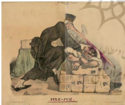
تصویر ۱۹. «پدر-اره»: اوگوست بوکه، ۱۸۳۲ (کتابخانه کنگره) (URL11).

فیلیپون به طور نمادین و کنایی در حالی که دست‌هایش بسته شده، از روی سینه بر روی بسته‌های روزنامه افتاده و