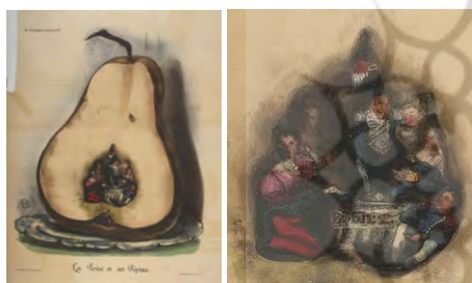
تصویر ۹. گلابی و دانه‌های درون آن: اوگوست بوکه، لیتوگرافی، منتشر شده در لاکاریکاتور، ۴ ژوئیه ۱۸۳۳، لوح ۲۹۰، ۳۵ × ۲۹/۵ cm (کتابخانه ملی فرانسه، پاریس) (URL3).

است که سر گلابی لویی فیلیپ را به صورت سه وجهی به تصویر می‌کشد و موهای گره خورده بالای سر او ساقه میوه را یادآوری می‌کند (تصویر ۱۰). در زیر نویس که احتمالاً فیلیپون آن را نوشته، خاطر نشان می‌کند که: «آنچه در آغاز کار بود: تازه و مطمئن؛ اکنون چه چیزی وجود دارد: رنگ پریده، لاغر و مضطرب؛ چه خواهد شد: ناامید و شکسته. صحت حال گذشته توسط هر کسی قابل تأیید است» (URL12). نبود هیچ نشانه‌ای که مستقیماً گلابی را به عنوان شاه مشخص کند، دومیه را حداقل این بار، از تکرار نزاع‌های دادگاهی فیلیپون نجات می‌داد.