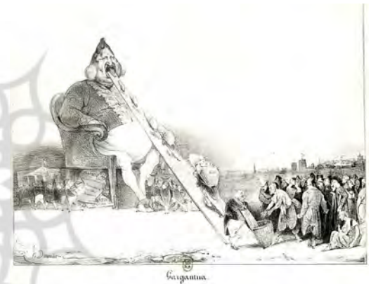
تصویر ۲. کارکانتوا، کاریکاتور لویی فیلیپ: اونوره دومیه، چاپ سنگی، ۱۸۳۲، لا کاریکاتور (URL3).

در لا کاریکاتور چاپ شده بود، از نقش گلابی بسیار استفاده می‌کرد، دستگیری او در سال ۱۸۳۲ به دلیل کشیدن کاریکاتور کارکانتوا (تصویر ۲) بود که لویی فیلیپ را به عنوان شخصیتی فاسد به تصویر کشیده بود.