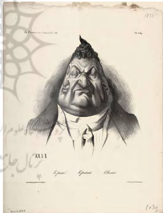
تصویر ۱۰. «گذشته، حال، آینده»: اونوره دومیه، منتشر شده در لا کاریکاتور، شماره ۶۶، در ۹ ژانویه ۱۸۳۴، لیتوگرافی، ۵/۲۸x۳۶ (موزه هنر متروپولیتن) (URL12).