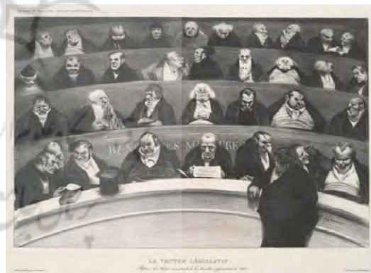
تصویر ۱۸. شکم قانون‌گذار: ظاهر نیمکت‌های وزارتی مجلس محافظه کار، ۱۸۳۴، اونوره دومیه، ژانویه ۱۸۳۴، لیتوگرافی، ۲۸/۲ × ۴۳/۵ cm، منتشر شده در نشریه انجمن ماهیانه، (موزه هنر متروپولیتن) (URL12).

جریمه‌های سانسور چاپ کارتونی در نشریات سیاسی را برای دومیه تأمین می‌کرد. «شکم قانون‌گذار» اولین لیتوگرافی است که توسط دومیه در نشریه انجمن ماهیانه منتشر شده است» (McPhee & Orenstein, 2012: 181). هنرمند در اینجا جلسه‌ای خیالی و ساختگی باسی و پنج نماینده «محافظه‌کار» تشکیل داده است، اشخاصی که برای بسیاری از آنها قبلاً پرتزه‌های کاریکاتوری کشیده بود.