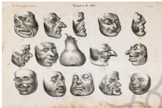
تصویر ۱۶. ماسک‌های ۱۸۳۱، چهره‌های کاریکاتور فیزیوگنومی: انوره دومیه، لیتوگرافی، لا کاریکاتور، ۱۸۳۲، شماره ۷۱، لوح ۲۹.۱۴۳ × ۲۱/۲ cm (کتابخانه ملی فرانسه، پاریس) (URL5).

در زیر هر یک از چهره‌های این کاریکاتور اسامی آنها به اختصار درج شده است. مجموعه گریماس، با حالات