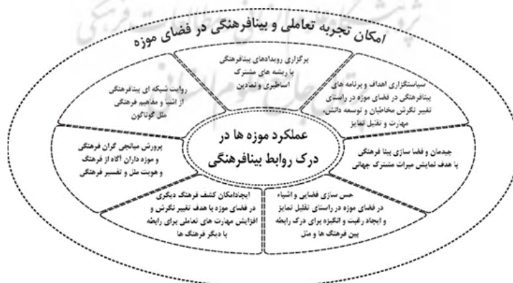
نمودار ۳. امکان تجربه تعاملی و بینافرهنگی در فضای موزه (منبع: نگارندگان)

(Mason, 2011: 5). با بیرون‌کشیدن معانی و روایت‌های جذاب می‌توان به نقاط اشتراک فرهنگ‌ها رسید. راهکار پیشنهادی موزه‌های پژوهش‌شده، «روایت شبکه‌ای بینافرهنگی» است. اثر در یک شبکه معنا پیدا می‌کند.