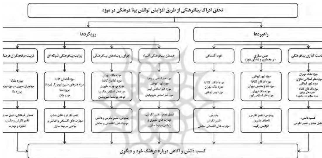
نمودار ۲. تحقق ادراک بینافرهنگی در فضای موزه‌ها

آن چنان که برخی از کارشناسان موزه‌ها اعتقاد دارند آثار همچون قطعات پازلی هستند که به تنهایی ناقص‌اند؛ از این رو باید در روایتی از دیگر قطعات پازلی خود همانند تاریخ خلق، هنرمند، چگونگی شکل‌گیری و فن و صنعتشان تعریف شوند. این روایت محوری بنا به نظر بایرام سبب می‌شود تا مخاطبان در شبکه‌ای از داده‌ها قرار گیرند و مهارت‌های اکتشافی و تعاملی و مهارت‌های مرتبط سازی بین فرهنگ‌ها را به دست آورند و نیز به حسب نظر بنت به سوی تقلیل تمایز و پذیرش بیشتر پیش روند. برقراری امکان تصور هم‌زمانی درباره یک اثر، پدیده یا رویداد، با برگزاری رویدادهایی با سناریوهای بینافرهنگی، در نگرش و دانش مخاطبان تأثیر به‌سزایی دارد. موزه‌ها بر حسب