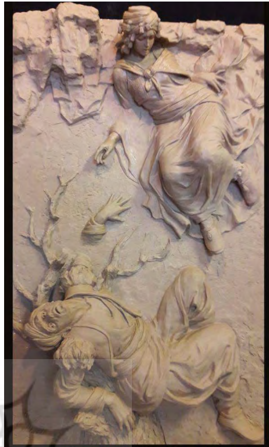
تصویر ۲. نقش برجسته «به بیت خه ج و سیامند»، اثر هنرمند مهدی ضیاءالدینی (منبع: آرشیو هنرمند)

تکنیک فرار «ره دوو که وتن» شاید در برخی از موارد باعث رسیدن به نتیجه دلخواه عشاق شود، ولی در بسیاری از موارد هم به نتیجه دلخواه نمی رسند. معمولاً خانواده‌ها از ترس آبرویشان با ازدواج فرزندان فراری‌شان موافقت می کنند، اما از طرف دیگر این افراد پس از ازدواج از خانواده‌ها طرد شده و حمایت آنها را برای مدتی طولانی یا همیشه از دست می دهند. معمولاً بعد از ازدواج، دختر از سوی پدر و خانواده پدری طرد می شود در زندگی اش تنهایی را تجربه