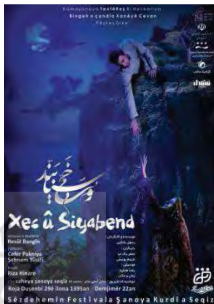
تصویر ۳. پوستر تئاتر خدیجه و سیامند، سیزدهمین جشنواره تئاتر کردی سقر ۱۳۹۵

سایر عشاق نیست. عشق خدیجه یک عشق پویا بوده و در این راه تاپای جان می‌رود. اگر عشق خدیجه معمولی بود پس از مخالفت خانواده، تسلیم تصمیم و اراده آنها می‌شد، اما خدیجه این امر را نپذیرفته و در راه عشق از خانواده گذر می‌کند. او در حین حفظ شرف، ناموس و موقعیت خانواده بر عشق و محبت خویش اصرار داشته و به همراه سیامند از