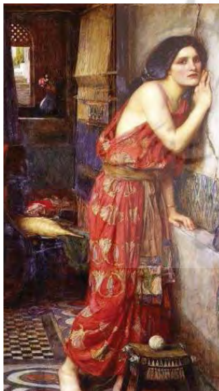
تصویر ۷. تیسبه در حال گفت و گو با معشوق از طریق شکاف دیوار، اثر جان ویلیام واترهاوس

خونین را می بیند (تصویر ۶). او پاره های روسری معشوق را از زمین برداشته به طرف درخت توت می رود و با شمشیرش خودکشی می کند، خون فواره زده بر روی توت ها ریخته و آنها را به رنگ سرخ تیره درمی آورد، اما مدتی بعد تیسبه به سوی