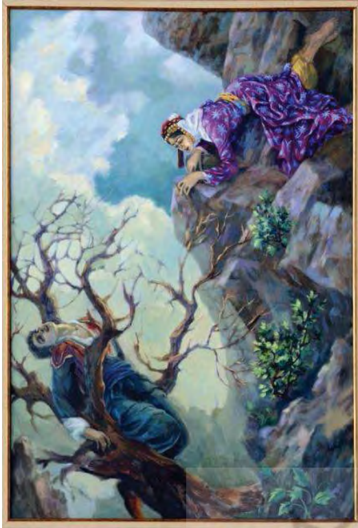
تصویر: تصویرسازی «به بیت خه ج و سیامند»، اثر هنرمند مهدی ضیاءالدینی