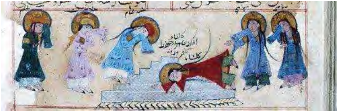
تصویر ۵. نگاره کتاب ورقه و گلشاه، گلشاه روی قبر ورقه جان داده است

می افتد. ماده شیر در راه بازگشت به جنگل روسری را پاره می کند. پیراموس از راه می رسد و رد پای شیر، روسری پاره و