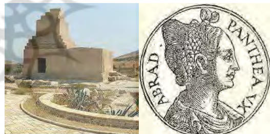
تصویر ۴. تصویر پانته آومقبره او و شوهرش

کند. هنگامی که ابراداتاس از طرف کوروش به سمت میدان جنگ با مصریان روان بود، پانته آدستان او را گرفت، در حالی که اشک از چشمانش سرازیر بود (تصویر ۴). ابراداتاس در جنگ کشته شد و پانته آبرسر جنازه او رفت و شیون و زاری کرد. کوروش به ندیمان پانته آسفار ش کرد که مراقب او باشند، اما پانته آدریک لحظه از غفلت ندیمان استفاده