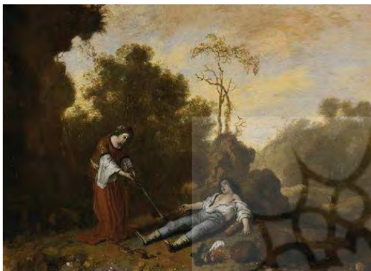
تصویر ۶. تیسبه به محل قرار برمی گردد، اثر باز تولومئوس برنبرگ (منبع: URL2)

می افتد. ماده شیر در راه بازگشت به جنگل روسری را پاره می کند. پیراموس از راه می رسد و رد پای شیر، روسری پاره و