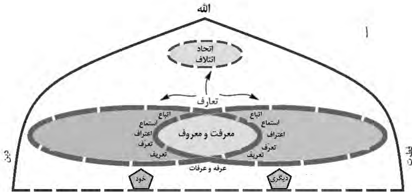
شکل ۲. تعارف: الگوی قرآنی ارتباطات میان فرهنگی

تعارف، آرامش و امنیت تعارف را حفظ کند و صدای «معروف» در آن شنیده شود، همانند روز «عرفه» و موقف «عرفات» در آیین حج که امکان تعارف را در بالاترین سطح فراهم می‌کند. ۱