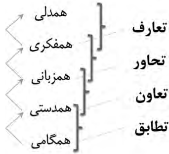
شکل ۳. مقایسه الگوهای ارتباطات میان فرهنگی

بی‌شک رسیدن به قلب، که خود بخشی از جهان غیب است، تنها با ایمان به غیب امکان‌پذیر است. مؤمن به غیب می‌تواند در پی تألیف قلوب باشد؛ چراکه به آن ایمان و دسترسی دارد. مراد از این قلب قطعاً پارهٔ صنوبری شکل کالبد و تن نیست، بلکه حقیقت جان آدمی است (وَ اللَّهُ يَعْلَمُ مَا فِي قُلُوبِكُمْ) ۱ (إِذْ كُنْتُمْ أَغْدَاءَ فَآلَفَ بَيْنَ قُلُوبِكُمْ) ۲ . وقتی که قلب‌های انسانی به همدیگر نزدیک شود (ائتلاف قلوب)، هم‌فکر و هم‌زبان خواهند شد، دست در دست هم خواهند داد و همگام با یکدیگر پیش خواهند رفت. تعارف با شناختی سرورکار دارد که با سیر آفاقی در زمین به سیر انفسی درون «قلب» منجر شود، و این شناخت با «شنیدن» و «شنیدار» (استماع) پیوند خورده است تا با دیدار و گفتار: