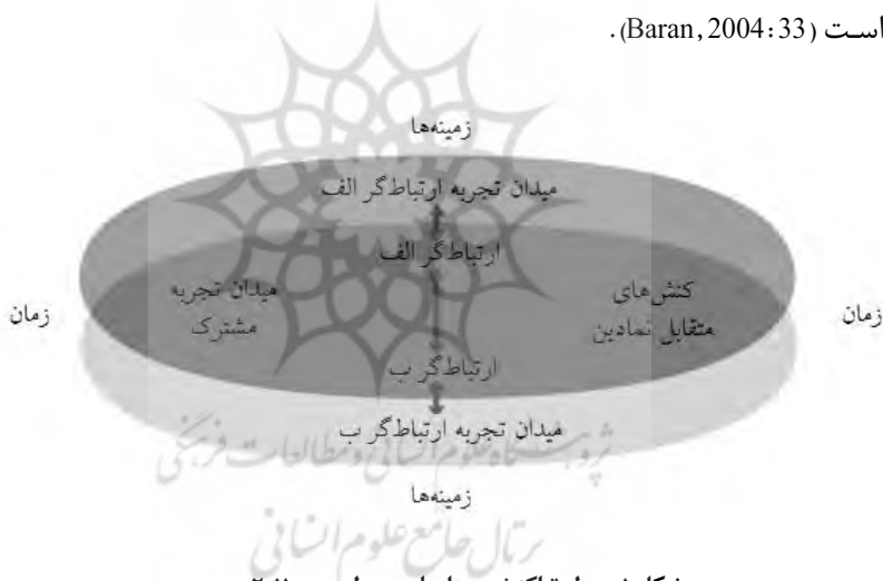
شکل ۱. مدل تراکنشی بر اساس مدل وود (۲۰۱۱)

سه برداشت اصلی از ارتباطات وجود دارد؛ «عمل» ۱ ، «معامله» ۲ و «تعامل» ۳ که به ترتیب بر اساس برداشت‌های فنی، تجاری و انسانی از ارتباطات مطرح شده‌اند. مدل خطی لاسول و شنون ۴ برداشت اولیه از ارتباطات است و مدل چرخشی شرام ۵ به برداشت دوم از ارتباطات مربوط می‌شود. فرستنده و گیرنده در مدل خطی و چرخشی اعمال و اهداف متفاوتی را دنبال می‌کنند؛ اما در مدل سوم، ارتباط‌گران ۶ تجربه زیسته مشترکی دارند که فعالانه و همدلانه هدف واحدی را پیگیری می‌کنند (Wood, 2011: 18). برداشت این پژوهش از ارتباط با مدل سوم تناسب دارد و ارتباط «تولید معنای مشترک» تعریف شده است (Baran, 2004: 33).