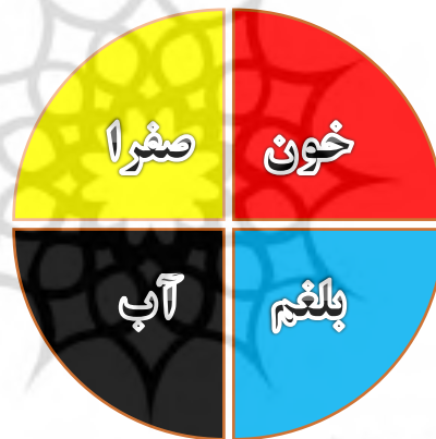
تصویر ۱. نظریهٔ اخلاط چهارگانهٔ بقراط

بنا بر این خلط چهارم در نظریهٔ اخلاط چهارگانهٔ بقراط آب است نه صفرای سیاه (سودا). بعدها این نظریه با نظریهٔ اخلاط چهارگانهٔ جالینوس که مان نظر مشهور است جایگزین شد.