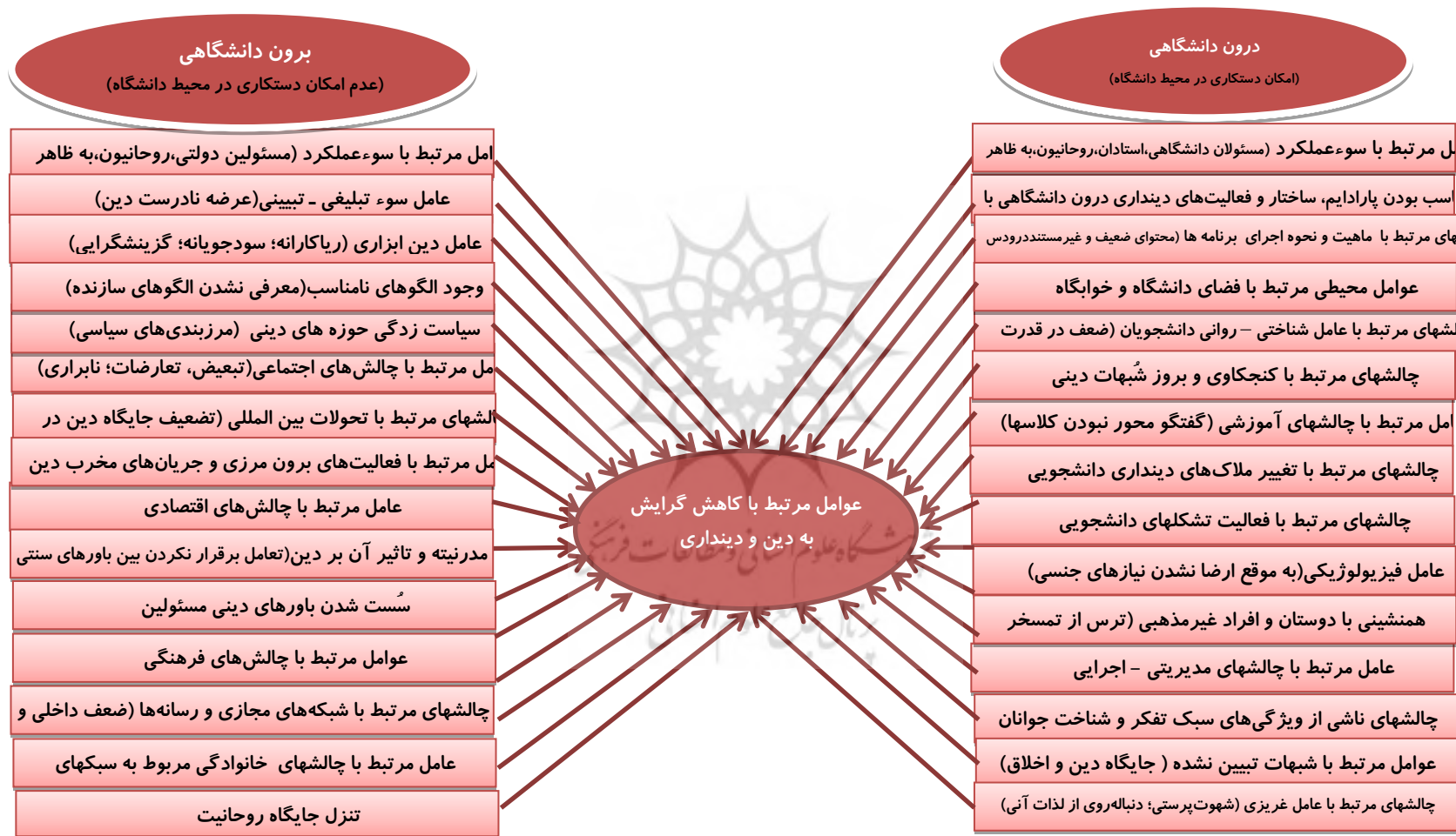
شکل ۲: عوامل مرتبط با کاهش گرایش دانشجویان به دینداری بر اساس تفکیک عوامل درون دانشگاهی و برون دانشگاهی