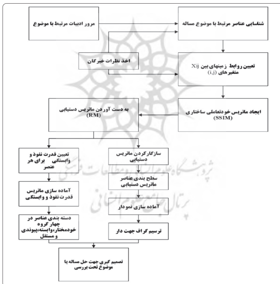
شکل ۱. مراحل اجرایی مدل ساختاری - تفسیری

- متغیرهای متصلی (پیوندی): قدرت نفوذ و وابستگی بالایی دارند و غیرایستا هستند، زیرا هر نوع تغییر در آنها می‌تواند سیستم را تحت تأثیر قرار دهد. بازخورد سیستم نیز می‌تواند این متغیرها را دوباره تغییر دهد. در واقع هرگونه عملی بر روی آنها به تغییر سایر متغیرها منجر می‌شود (Ibid.). - متغیرهای مستقل: این متغیرها از قدرت نفوذ بالا و وابستگی پایینی برخوردارند (Mandal and Deshumukh, 1994).