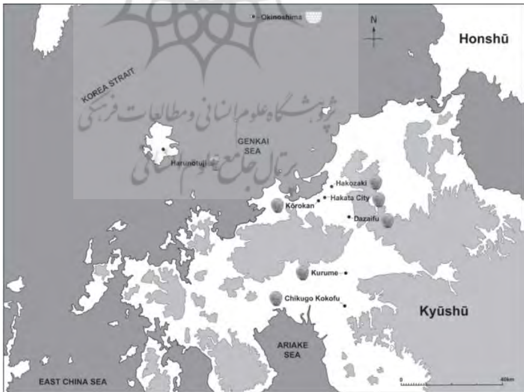
تصویر ۶. محل کشف سفال‌های سبز آبی و شیشه ساسانی در کیوشو (Priestman, 2016: 17).