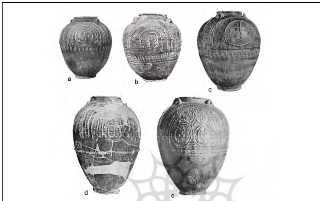
تصویر ۳. ظروف سفالین سبزابی؛ محل کشف از چپ به راست: ایران، سیراف، شوش، بمپور، نامعلوم (Priestman, 2016: 6).

558: 2008)، حضور شاهدخت نیشیزاوا هیروه‌کو (Nishizawa Hireku) نسل پنجاه و سوم ساسانیان (رجب‌زاده، ۱۳۸۳: ۳) و یا داستان کوش‌نامه (ایرانشان بن ابی‌الخیر، ۱۳۷۷: ۷۴-۷۳) چون موارد به خصوصی هستند، تغییری در نتیجه فوق‌ایجاد نمی‌کنند.