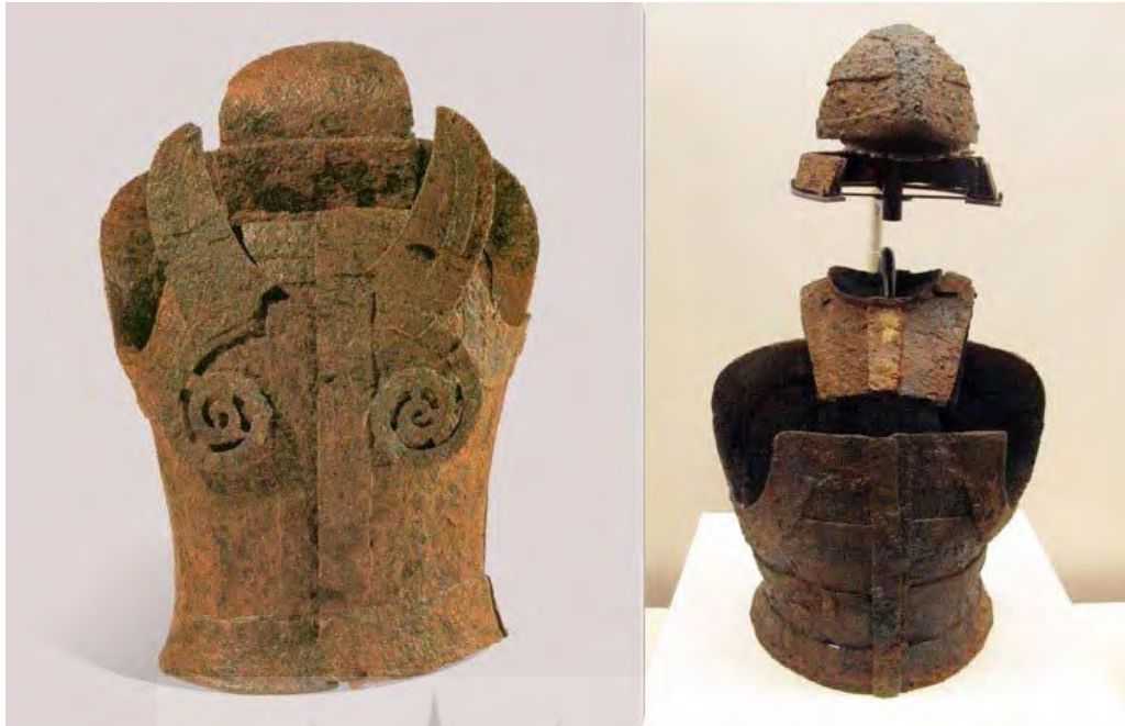
تصویر ۵. سمت راست: زره نوع یاماتو، و سمت چپ: زره یافت شده از کایا سده ۵ م. ( https://jref.com/ ). (articles/yamato-court.197)