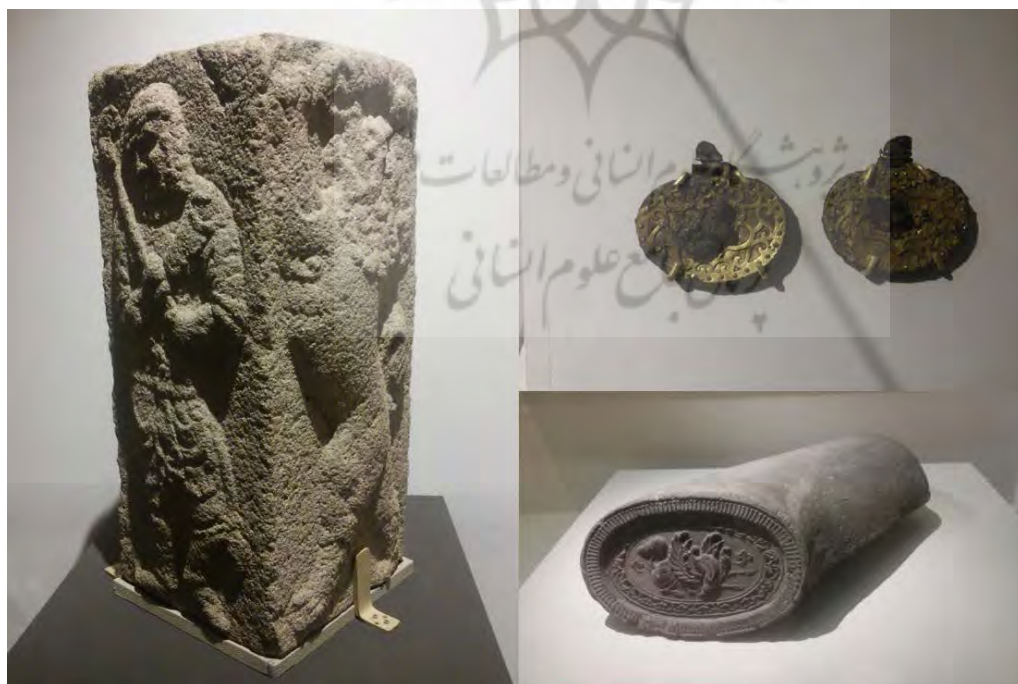
تصویر ۴. بالا سمت راست: لگام اسب از آرامگاه چان‌مه چون سده ۶ م.، پایین سمت راست: حاشیه شیروانی سده ۸ م.؛ و سمت چپ: ستون حکاکی‌شده از محوطه کوجان سده ۸ م. (نگارنده، از نمایشگاه سیلا و پارس تهران).