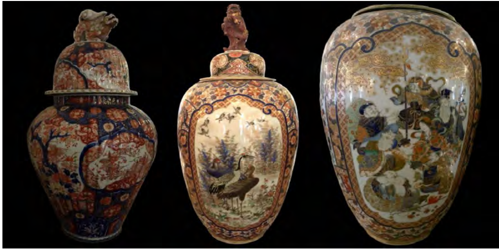
تصویر ۱۱. سه ظرف از مجموعه ظروف نوع میچی کاخ گلستان (نگارنده، ۱۴۰۰).