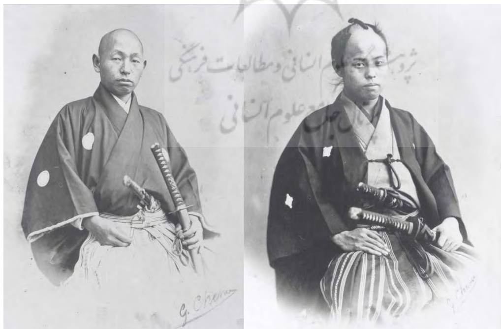
تصویر ۱۰. سمت راست: یوشیدا ماساهارو (Yoshida Masaharo) (۲-۲۵-۳۰۲ ثبت موزه کاخ گلستان)، و سمت چپ: فوروکاوا نوبویوشی (Furukawa Noboyushi) (۱-۲۵-۳۰۲ ثبت موزه کاخ گلستان) دو عضو بلندپایه هیأت اول ژاپن به ایران.