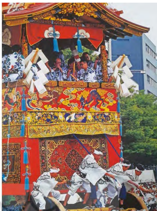
تصویر ۹. سمت چپ: یک نمونه جین بئری ساخته شده از پارچه صفوی سمت راست: فرش ایرانی در گیون ماتسوری. (ponica, 2019: 7).