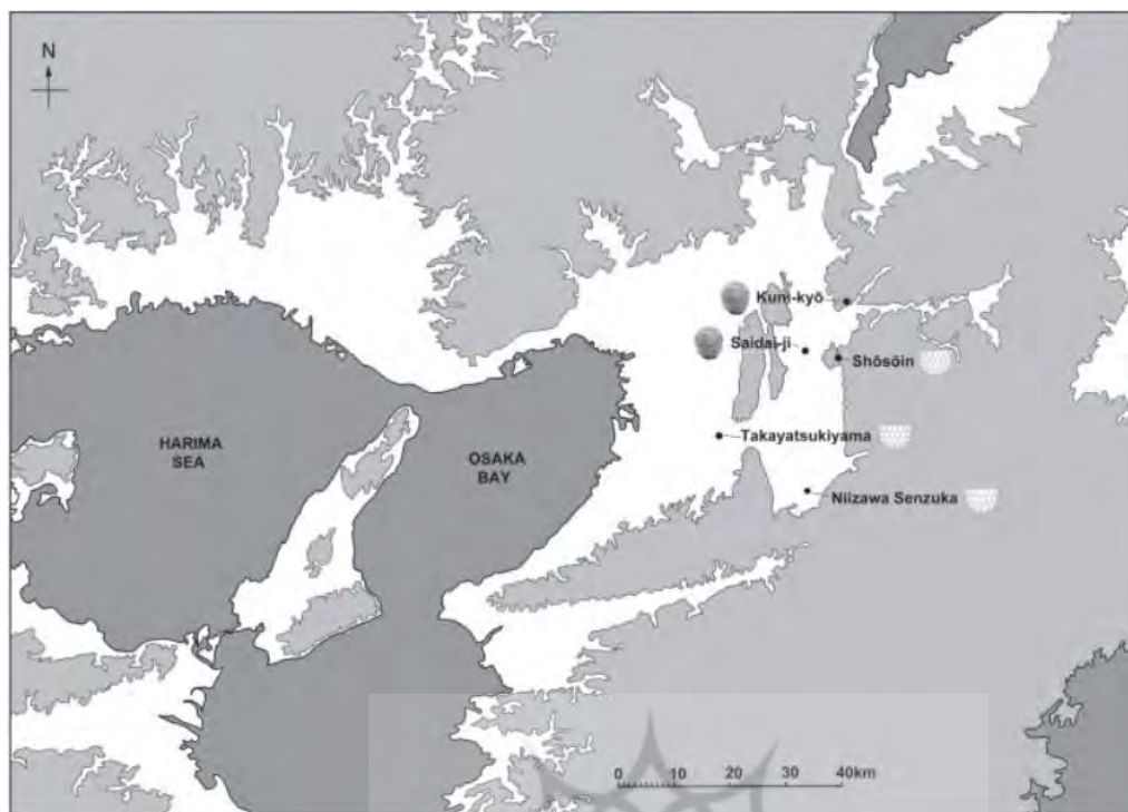
تصویر ۷. محل کشف سفال‌ها و شیشه‌های ساسانی در نارا و کیوتو (Priestman, 2016: 20).