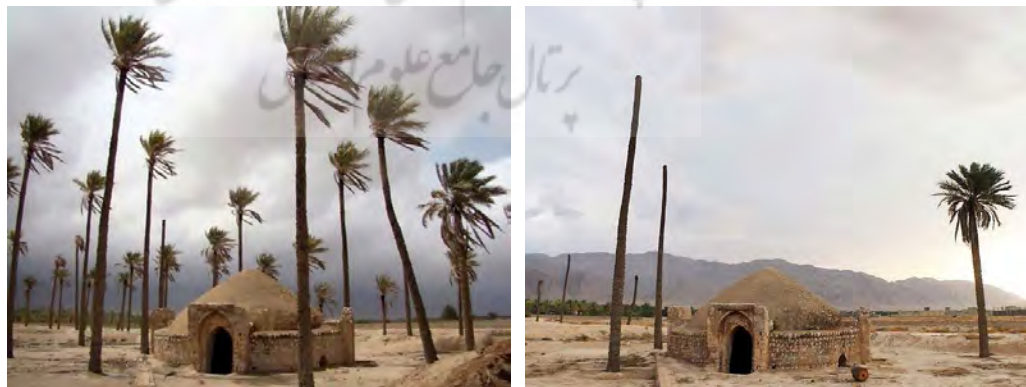
تصاویر ۱ و ۲. نخلستان، آبیاری با آب برکه و پس از ترک آبیاری.

پرسش پژوهش: پرسش اصلی پژوهش این است که، با توجه به کم‌آبی منطقه آیا می‌توان با احیاء فنون گذشته به بازسازی این سازه به صورت امروزی پرداخت؟ روش پژوهش: این پژوهش به روش مطالعات کتابخانه‌ای و میدانی در طی یک بررسی میدانی