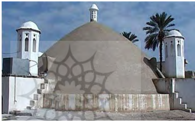
تصاویر ۱۶ و ۱۷. نمونه‌ای از برکه دارای بادگیر (شاه‌عباسی لار، پیش و پس از مرمت)، (خبرگزاری تسنیم، ۱۳۹۵).