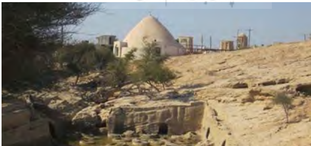
تصویر ۳. برکه در کنار چاه‌های آب تلا، قشم.

ذخیره کردن آب را «آبدان»، «آبگیر»، «تالاب»، «مصنع» و «برخ» (دهخدا، ۱۳۷۷) گویند. با این‌وصف، واژه «برکه» در منابع فارسی متأخرتر اسلامی دقیقاً به معنی آب‌انبار بسیار به‌کار برده شده است. نوعی از مخازن آب در بیشتر نقاط سرزمین ایران «آب‌انبار» (عابدینی و همکاران، ۱۳۸۳ به نقل از: دانشنامه ایران و اسلام؛ گلزاری، ۱۳۵۷: ۵۳؛ افشار، ۱۳۴۵: ۷۴/۱، ۱۰۰، ۸۶/۲، ۶۶۵-۶۶۹؛ آیت‌الله زاده شیرازی، ۱۳۴۹: ۳۶-۳۰) و در برخی نقاط چون: بیرجند «انبار»، حوض (همان‌جا، به نقل از: ابن بلخی، ۱۳۸۵: ۱۵۶؛ افشار، ۱۳۴۵: ۷۴/۱؛ قس: ناصر خسرو، ۱۳۷۰: ۶۵، ۱۲۲)، برکه