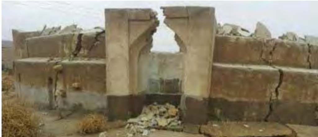
تصویر ۶. تخریب یکی از برکه‌ها به دلیل عدم رسیدگی (عصر لارستان، ۱۳۹۵).