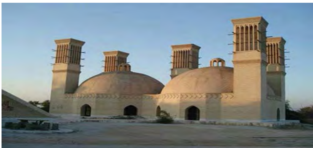
تصویر ۱۳. برکه دوقلو یا پنج بادگیره جزیره کیش (همشهری آنلاین، ۱۳۹۰).

می‌کنند (سروشیان، ۱۳۷۶: ۶۰-۵۹). هم‌چنین برای جلوگیری از گرم‌شدن و فساد آب، مصالح ساختمانی برکه‌های حاشیه شمالی خلیج فارس از سنگ و ساروج با پوشش اندود گچ نیم‌کوب برای تأثیرگذاری کمتر نور خورشید جهت جلوگیری از حرارت طاقت‌فرسای منطقه بر آب بوده است. برخلاف کرمان که بیشتر مصالح آب‌انبارها از آجر و خشت بوده، به این نحو که بیشتر مخازن با آجر و بیشتر سقف‌ها با خشت ساخته شده تا از انتقال حرارت به سطح آب جلوگیری شود.