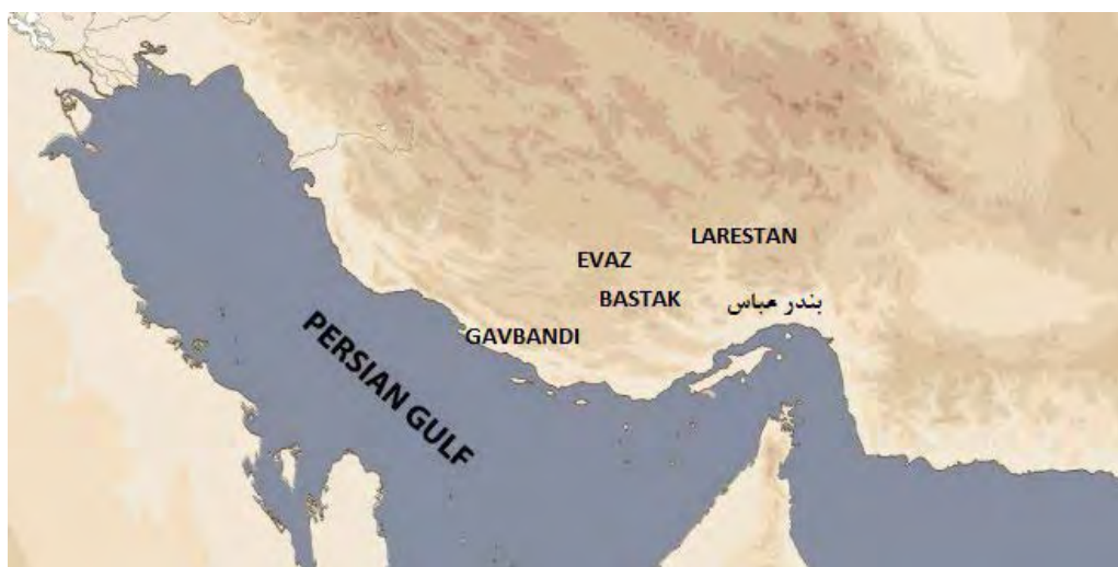
نقشه ۱. موقعیت جغرافیایی شهرهای مورد مطالعه (نگارنده، ۱۴۰۰).