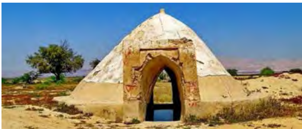
تصویر ۱۴. برکه‌ای کوچک نزدیک روستای مالا، بندر لنگه.