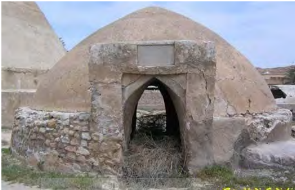
تصویر ۱۰. برکه سلفی اوز.

۱۹- «پیس‌پو» (pispo) یا چشم‌زخم که در نقاطی از فارس به نام «سولوک-دولوک» معروف است، شامل طرح‌های مثلثی شکل از منسوجات غالباً سورمه‌ای رنگ همراه مواد طبیعی مانند نمک و ذغال و نیز گیاهان مقدسی هم‌چون آویشن و اسفند که برای جلوگیری از چشم بد به جاهای مختلف از جمله برکه می‌آویختند. بخش عمده‌ای از آب‌انبارها پیوند عمیق و محکمی با سنت وقف داشته و دارند. یکی از کارکردهای وقف در جامعه مورد بحث این پژوهش از گذشته تاکنون در مرمت و نگهداری بناهای مذهبی و عام‌المنفعه است. ابعاد نگهداشت آب‌انبارها در ساختار جوامع بسیار گسترده است (شهبابی، ۱۳۴۳: ۱۰). آب‌انبار و وقف آن به عنوان یک سنت حسنه و وظیفه اجتماعی بود که توسط اغنیا و افرادی که دارای مکتب مالی بودند، صورت می‌گرفت. آب‌انبارها توسط اهالی هر محلی اداره می‌شدند و از کسی مبلغی برای استفاده از آن گرفته نمی‌شد (عطاریها، ۱۳۸۴: ۱۸۷).