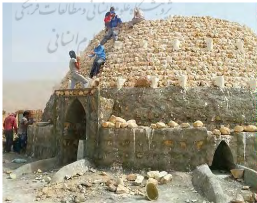
تصویر ۱۸. ساخت برکه جدید به عنوان یک سنت دیرینه.