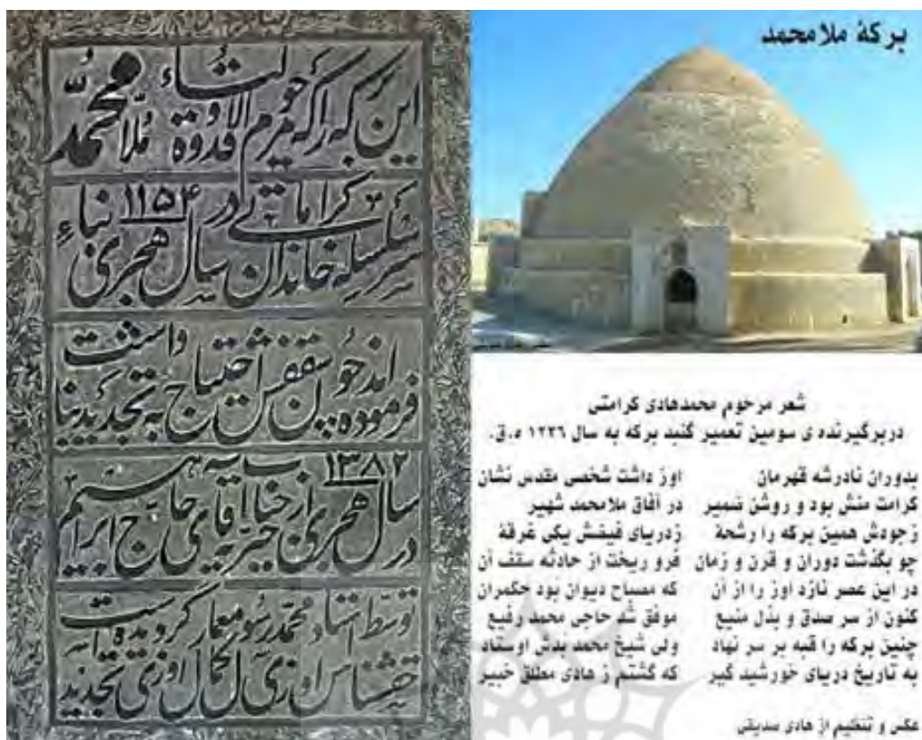
تصویر ۱۱. کتیبه‌های برکه ملا محمد.