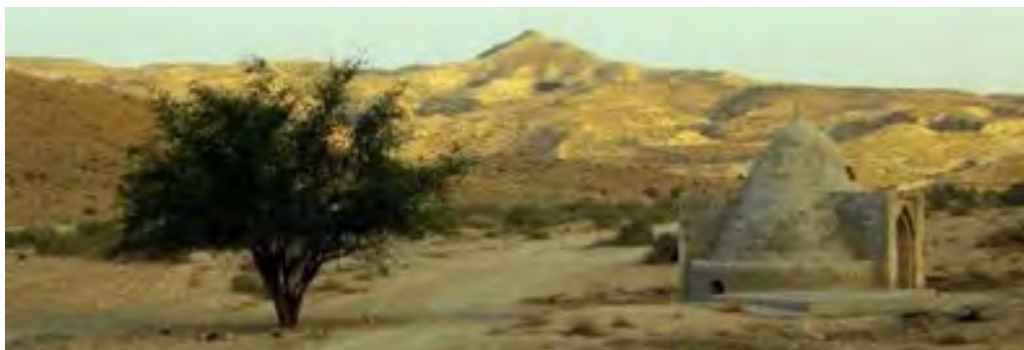
تصویر ۱۵. برکه‌ای کوچک در پیرامون اوز.