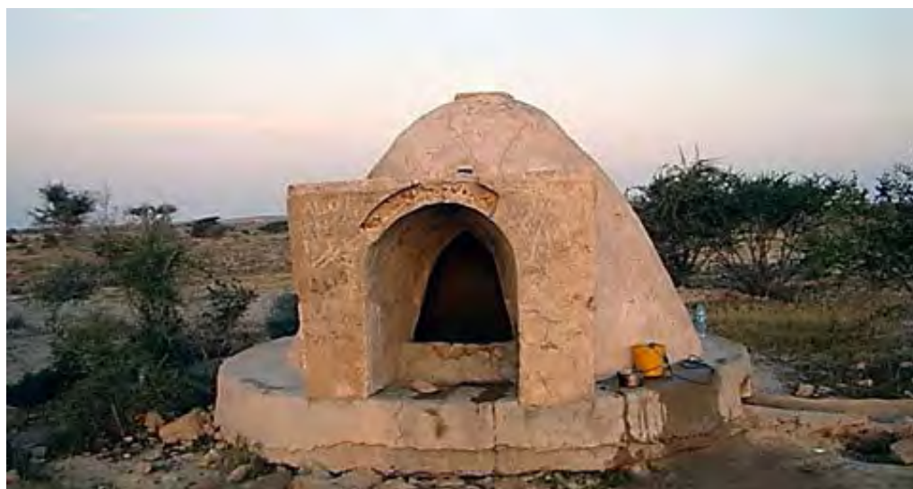
تصویر ۷. برکه‌ای کوچک در پیرامون گاوبندی.