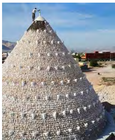
تصویر ۹. قرار دادن کاکل برکه پس از بازسازی گنبد (عکس از: هادی صدیقی).

سنگ و گچ به کاررفته در ساخت گنبد بوده و از طرف دیگر تاحدودی مانع نفوذ گرما و سرما به برکه می‌شود. در حاشیه‌های دریا گاهی از سنگ‌های مرجانی برای ساخت گنبد روی برکه استفاده می‌شد (پورجعفر، ۱۳۸۱ الف: ۴۱). معماران ابتدا مخزن برکه را می‌ساختند و برای مدتی آن را به حال خود رها می‌کردند تا از آب پر شده و نشست خود را کند و سپس شروع به ساخت دیواره و گنبد می‌کردند تا به این ترتیب مانع شکستن کف مخزن با سقوط سنگ‌ها شده و نیز خطر کمتری با سقوط کارگران از روی گنبد به داخل برکه آن‌ها را تهدید کند. هنگام مرمت هم این قاعده را رعایت می‌کردند.