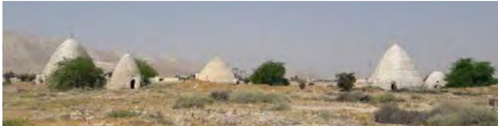
تصویر ۴. تعدادی از برکه‌های بستک (خبرگزاری راه دانا، ۱۳۹۶).

(افشار، ۱۳۴۵: ۱۰۴/۱، ۲۲۲، ۶۵۲/۲، ۶۵۵)، مَنبَع و در دیگر شهرهای ایران با نام‌هایی چون: مُرغی و مُرغک (در ساوه) و هَوْد، احتمالاً صورتی دیگر از حوض (در جندق و بیابانک) خوانده می‌شود، مانند بیشتر منازل بین راه نایین به انارک که به حوض مشهورند و مراد از حوض برکه‌های کوچکی است برای کاروانیان (افشار، ۱۳۴۵: ۸۷). در یزد نیز به آب انبار «اومبار» گفته می‌شود (ملکزاده و خانی‌سانچ، ۱۳۹۲: ۱۴۰). در دیگر سرزمین‌های اسلامی نیز به وجود این نوع مخازن با نام‌های «مَصْنَع» (در مصر)، «سردابه» (در ترکمنستان)، «خَزَان» (در فلسطین)، «حوض» (در هرات) اشاره شده است (عابدینی و همکاران، ۱۳۸۳ به نقل از ناصرخسرو، ۱۳۵۴: ۵۰، ایرانیکا؛ الموسوعه الفلسطينية، ۳۴۱/۲؛ مایل‌هروی، ۱۳۵۴: ۳۷).