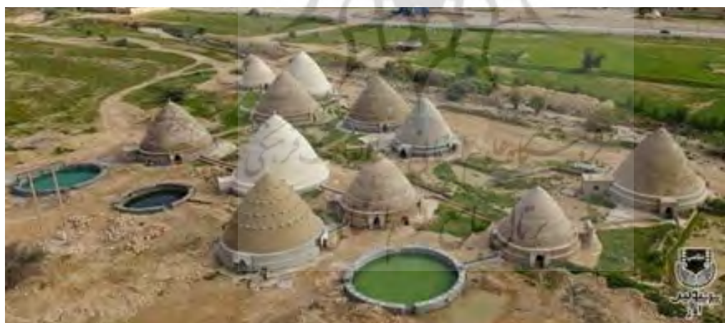
تصویر ۱۲. نمایی از یازده برکه (عکس از: موزه مردم‌شناسی اوز).

برکه در تاریخ ۲۷ دی‌ماه ۱۳۷۹ با شماره ۳۲۹۲ در فهرست آثار ملی ثبت شده است. حجم مخزن «برکه گنج‌البحر» (در زبان محلی «گل») در شهر گراش استان فارس با قطر ۲۹ متر و ارتفاع ۲۱ متر، حجمی برابر با ۱۳۸۷۲،۹۲ مترمکعب آب است.