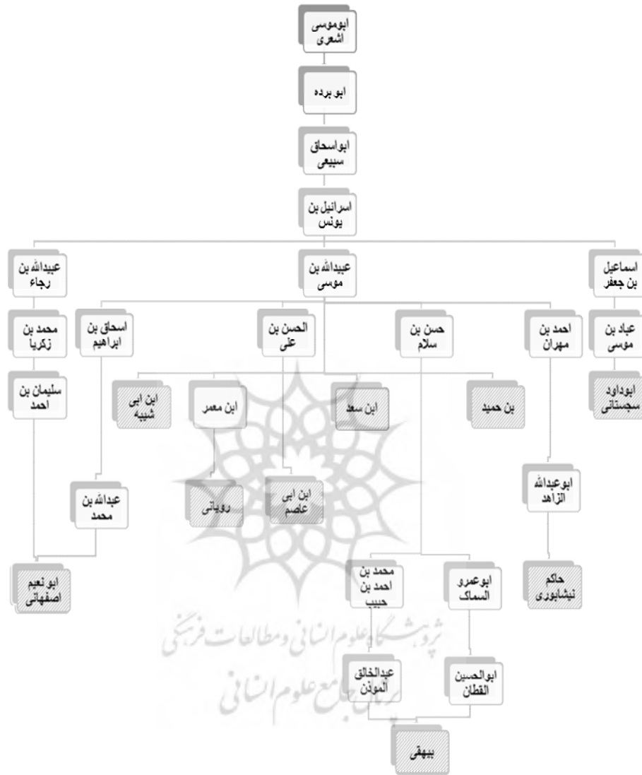
ترسیم شبکه اسناد بصری حلقه مشترک سندی (ب)

حبشه به شمار نیاورده‌اند (ابن عبدالبر، ۱۴۱۲: ۱۷۶۳/۴). ذهبی با اشاره به سند اخبار هجرت منتهی به وی، به شمار آوردن ابوموسی اشعری جزو مهاجران حبشه را وهم برخی از راویان دانسته است (ذهبی، ۲۰۰۳: ۵۸۲/۱). بنابراین به دلیل اینکه یکی از