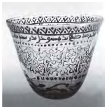
تصویر ۱: پیاله زرین فام متعلق به سوریه، قرن ۸ میلادی، موزه شیشه کورنینگ. ۱

به لحاظ تاریخی تنها چند اثر زرین فام شیشه وجود دارد که دارای کتیبه حاوی منطقه و تاریخ ساخت است. از جمله مهم‌ترین این آثار می‌توان به پیاله شیشه‌ای زرین فام، متعلق به دمشق سوریه اشاره کرد. (تصویر ۱)