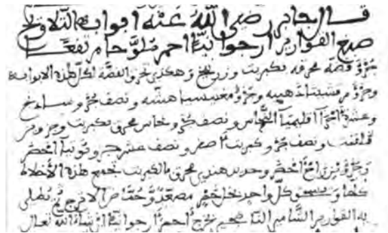
تصویر ۵: اشاره مستقیم جابر ابن حیان به قواریر شامی در اولین فرمول ۱

همچنین یک نمونه از زرین فام شیشه که تزئینات آن دارای نقره است در حفاری‌های نیشابور ایران به دست آمده است. (تصویر ۶) این اثر را می‌توان به قرن ۹ میلادی (۳ ق) نسبت داد. تفاوت شیشه آن با نمونه‌های مصری نشان می‌دهد که خارج از مصر نیز کارگاه‌های ساخت چنین شیشه‌هایی وجود داشته است. ۲