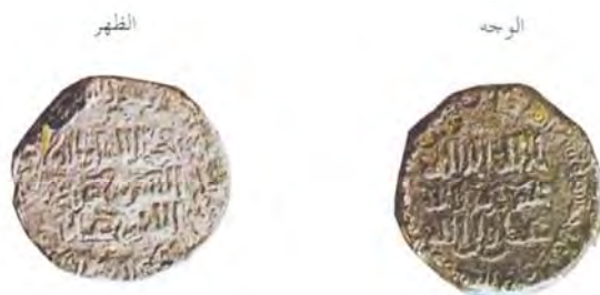
شکل رقم (۸)

تصاویری از سکه‌های برجای مانده از عصر عیونی و نقاشی از متن آنها، برگرفته از «نقود الدوله العیونیه»