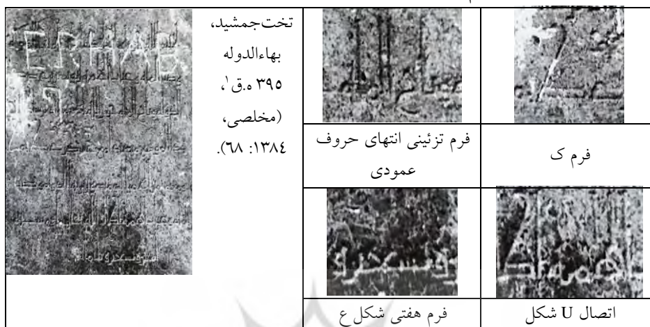
جدول ۷- مشابهت فرم نوشتاری کتیبه بهاءالدوله در تخت جمشید با سکه‌های گروه «ب»

براساس مؤلفه‌های تعریف شده، مهم‌ترین ویژگی‌های این گروه این‌گونه بیان می‌شود: