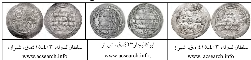
جدول ۱۲. مشابهت نحوه اتصال و ارتفاع حروف کتیبه بهاء‌الدوله در تخت جمشید با سکه‌های گروه «ج»