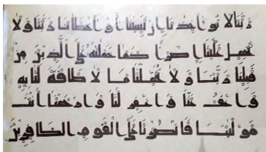
تصویر ۲. خط کوفی قرون سه و چهار (عاصف، ۱۳۷۷: ۶۴)

نوشتار در سکه‌های این گروه، بیشترین شباهت را به خط کوفی اولیه دارد (تصویر ۱) و فاقد تزئینات است. مظهر صفات گروه الف، سکه ضرب سسال ۳۵۳ ه.ق دوره عضدالدوله است (جدول ۲).