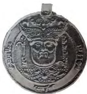
تصویر ۱ (وايه، ۱۳۶۳: ۳۹)

سه سبک اصلی ضربخانه‌های جبال، عراق و فارس را در درهم‌های بویهی می‌توان باز شناخت. درهم‌های ضربخانه‌های عراق محافظه‌کارترین سبک را دارند و در این میان، درهم‌های ضرب مدینه‌السلام و ضربخانه‌های هم‌جوار آن، به درهم‌های عباسی می‌ماند و به استثنای چند نمونه از اواخر قرن چهارم و اوایل قرن پنجم هجری قمری، نشانی از طرح‌های نوآورانه دیگر مناطق دیده نمی‌شود (رضایی باغبیدی،