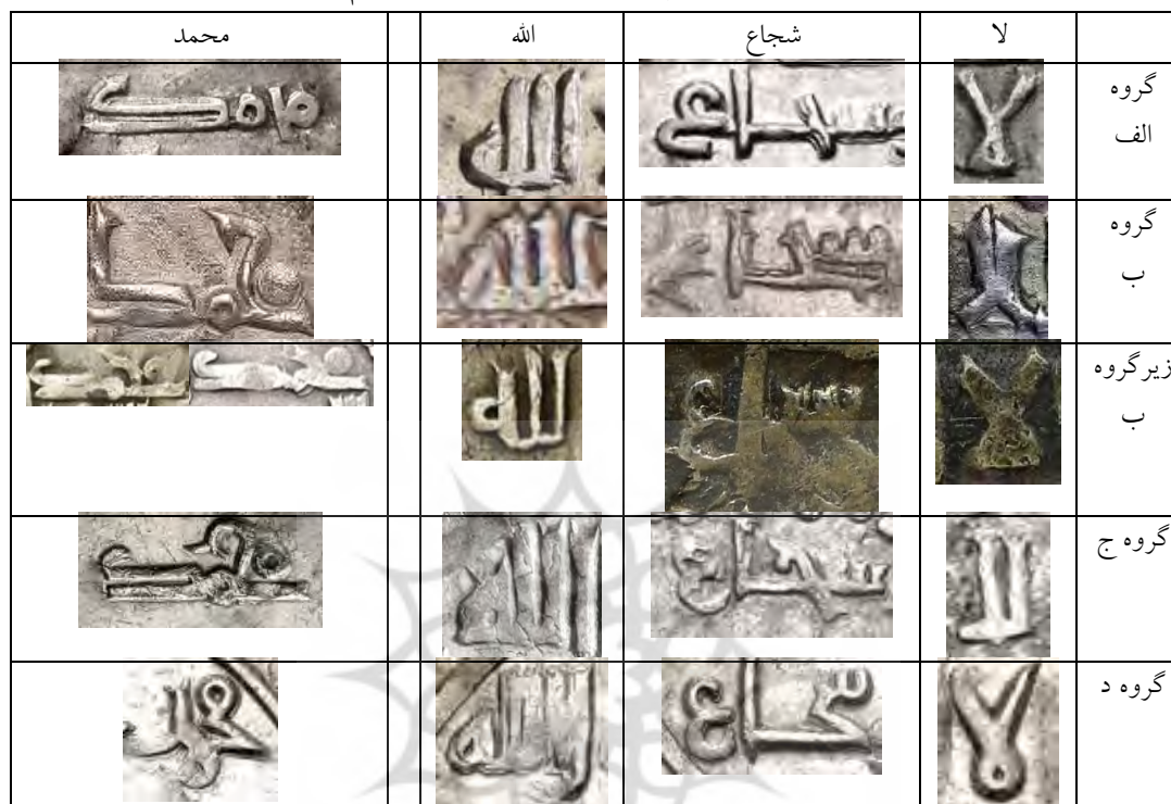
جدول ۱۷. مقایسه کلمات پر تکرار بر روی سکه‌ها در تمام گروه‌ها