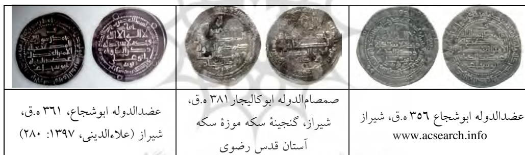
جدول ۳. مشابهت سکه‌های دیگر ضربخانه‌ها با سکه‌های گروه «الف»