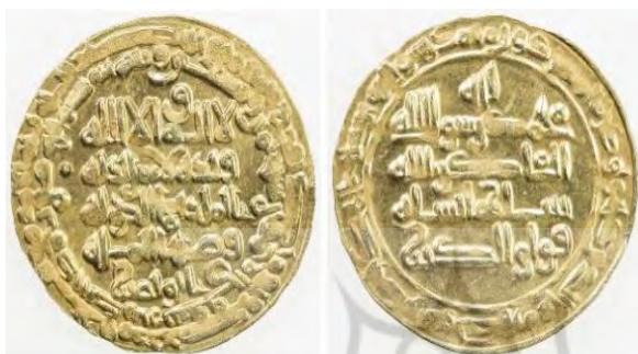
تصویر ۳. بهاء الدوله ۳۹۸ ه. ق، سوق الاهواز

زیرگروه، گاهی همانند گروه «الف» و گاهی همانند گروه «ب» نگارش شده‌اند. ضخامت ۱ خطوط نیز در نوشتار این زیرگروه متغیر است، بعضی حروف روی سکه‌ها نازک و بعضی ضخیم‌اند. این زیرگروه، شبیه یک طبقه و سبک التقاطی است که نمی‌توان مؤلفه‌های مشترکی را برای تمامی آثارش تعریف کرد.