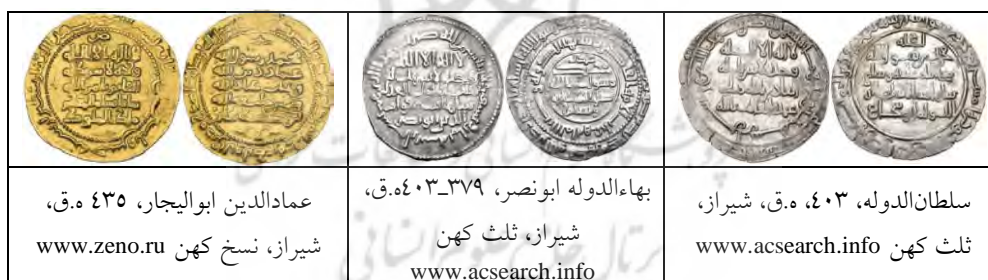
جدول ۱۴. نمونه سکه‌های گروه «د»