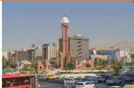
شکل ۲. فلکه دوم صادقیه