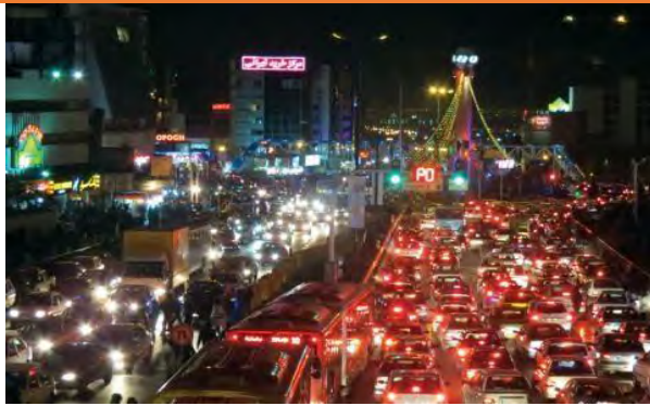
شکل ۳. محور ارتباطی به سمت فلکه دوم صادقیه