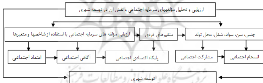
شکل ۲. مدل تحلیلی ارتباط توسعه شهری و سرمایه اجتماعی در شهر زابل

آزمون T تک نمونه‌ای؛ یک آزمون پارامتری است که به منظور تعیین معناداری تفاوت بین دو میانگین به کار می‌رود. آزمون T یک نمونه‌ای که ساده‌ترین نوع است تعیین می‌کند که آیا میانگین مشاهده شده در مقایسه با یک مقدار تعیین شده، متفاوت است یا خیر. آزمون T تک نمونه‌ای زمانی به کار می‌رود که یک نمونه از جامعه داریم و می‌خواهیم میانگین آن را با یک حالت معمولی و رایج، استاندارد و حتی یک عدد فرضی و مورد انتظار مقایسه کنیم. به عبارتی در این آزمون فرض بر این است که نمونه‌ای به حجم n و میانگین m از یک جامعه انتخاب کرده‌ایم و می‌خواهیم بدانیم که آیا می‌توان این نمونه را یک نمونه‌ی تصادفی از جامعه‌ای که میانگین آن m است، دانست (افشانی و همکاران، ۱۳۹۵: ۲۵۳).