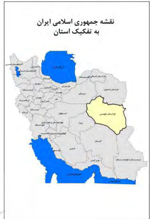
تصویر ۴: موقعیت استان خراسان جنوبی در کشور و نقشه تقسیمات کشوری استان خراسان جنوبی