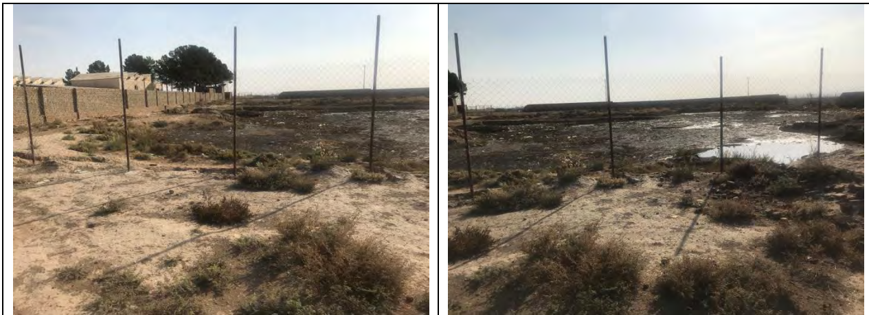
شکل شماره ۱: کشتارگاه صنعتی دام سبزوار

گیرد. همچنین ارزیابی استراتژیک می تواند به عنوان یک ابزار مهم برنامه ریزی در دسترس برنامه ریزان و سیاستگذاران قرار گیرد تا بر این اساس بتوانند اثرات بالقوه زیست محیطی که در نتیجه اجرای طرح های توسعه ای و برنامه های عمرانی پایدار می شوند را شناسایی کرده و گزینه های منطقی جهت رفع یا کاهش آن ها را پیشنهاد کند(منوری، ۱۳۸۴: ۲۳).