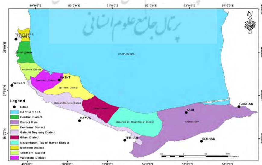
شکل ۲. مجموعه زبان‌های حاشیه دریای خزر

زبان گیلکی از گروه زبانهای ایرانی شاخه شمال غربی است که زبان مادری اکثر مردم استان گیلان است. گیلکی در محدوده استان گیلان از شرق با گویشوران مازندرانی و از غرب با گویشوران تالشی و از جنوب با گویشوران تاتی همجوار است و در درون محدوده خود دارای گونه‌هایی است (Rüdiger, 2000). زبان گیلکی از گروه زبان‌های شمال غربی ایرانی و در مجموع زبان‌های حاشیه خزر است. زبان گیلکی، مشتمل بر سه لهجه بیه‌پسی (غرب گیلان)، بیه‌پیشی (شرق گیلان) و گالشی (مناطق کوهپایه‌ای و کوهستانی گیلان و غرب مازندران) می‌باشد. مردم شمال غربی گیلان، به زبانی دیگر از خانواده گویش‌های کناره دریای خزر که زبان تالشی باشد تکلم می‌کنند. گیلکی نزدیکی زیادی با زبان مازندرانی داشته و گویشوران این دو زبان تا حد نسبتاً زیادی می‌توانند سخنان هم دیگر را بفهمند. گیلکی تنها در ایران رواج دارد و شبکه استانی گیلان بخشی از برنامه‌های تلویزیونی خود را به این زبان اجرا می‌کند. گیلکی به عنوان زبان رسمی جلسات شورای شهرستان رشت تعیین شده است (Rostar Giva, 2012).