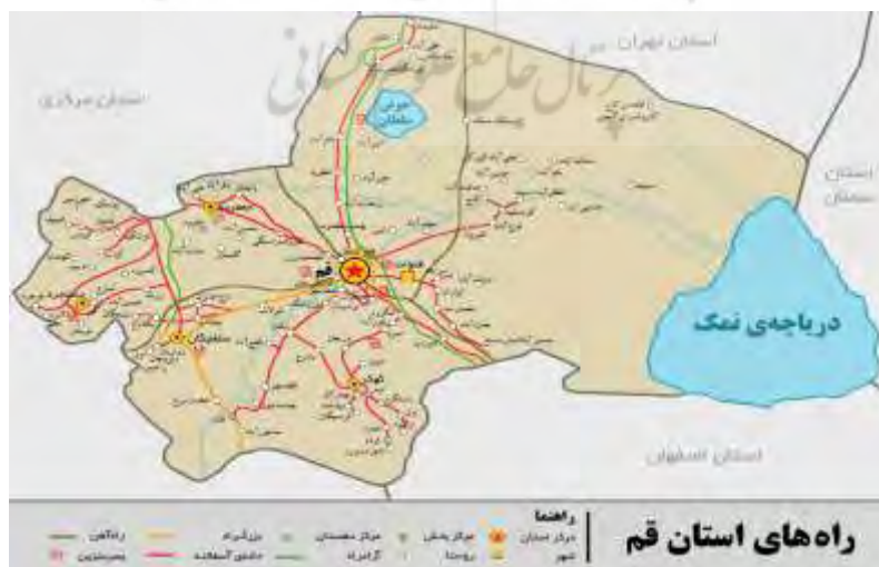
شکل ۳. راه های ارتباطی در استان قم و منطقه مورد مطالعه