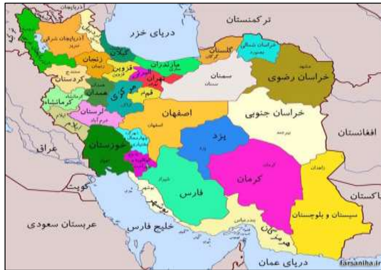
شکل ۱. موقعیت استان قم در نقشه ایران