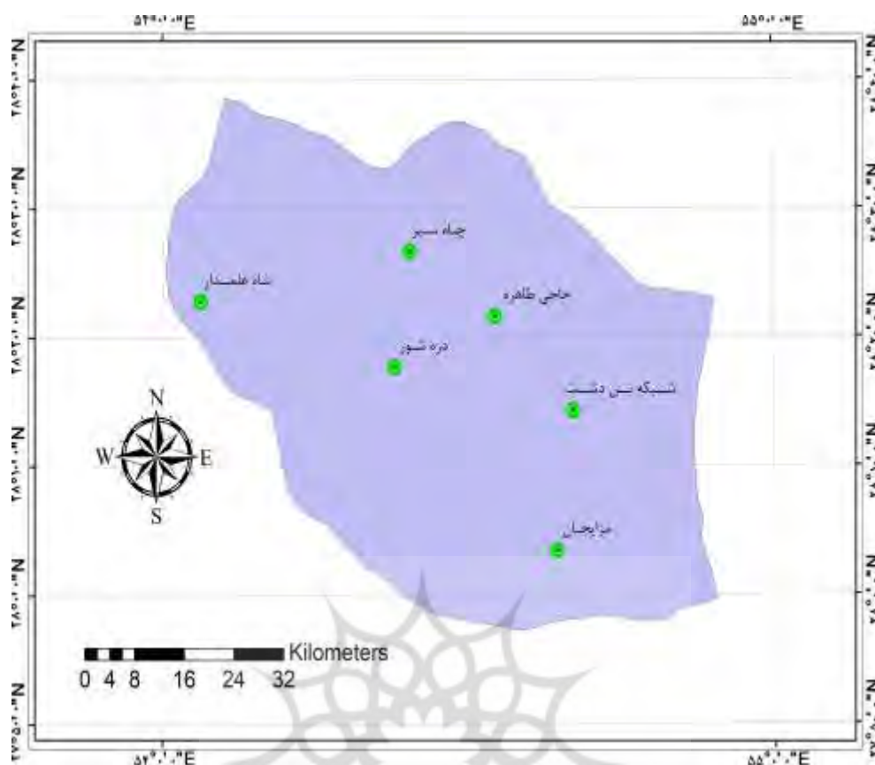
شکل ۲. موقعیت روستاهای نمونه در شهرستان