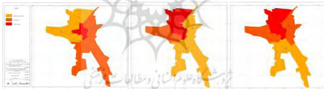
شکل ۲. سطح بندی شاخص های آموزشی شکل ۳. سطح بندی شاخص های بهداشتی درمانی شکل ۴. سطح بندی شاخص های فرهنگی اجتماعی

بنابراین بر اساس ضرایب توسعه یافتگی در مدل تاپسیس مناطق پنج گانه از لحاظ میزان برخورداری از شاخص های شهری با استفاده از GIS سطح بندی گردیده است که وضعیت مناطق پنج گانه شهر رشت از لحاظ توسعه یافتگی پس از تلفیق شاخص های مورد مطالعه در مدل مذکور به شرح شکل های ۲، ۳، ۴، ۵، ۶ مشخص می گردد. بر این اساس آنچه که از تلفیق شاخص ها به عنوان درجه توسعه یافتگی در مقیاس شهری نمایان است منطقه یک و دو توسعه یافته و منطقه سه و چهار در حال توسعه و منطقه پنج کمتر توسعه یافته قلمداد می گردد.