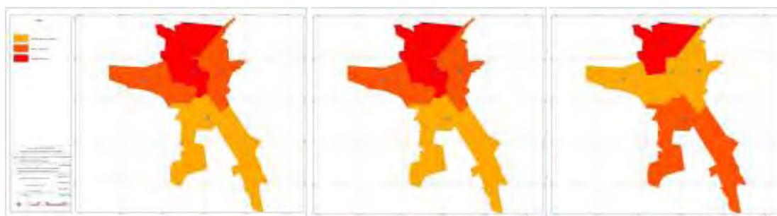
شکل ۵. سطح بندی شاخص های اقتصادی تجاری شکل ۶. سطح بندی شاخص های تاسیسات شهری شکل ۷. سطح بندی بر اساس تلفیق شاخص ها