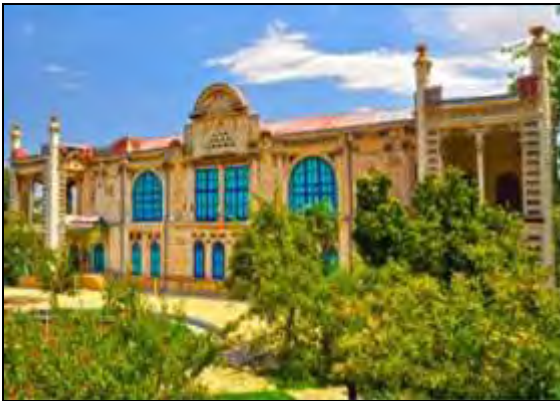
شکل ۶. کاخ موزه باغچه جوق