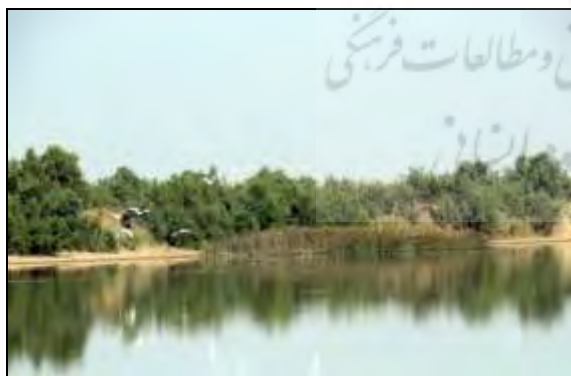
شکل ۴. تالاب آق گل