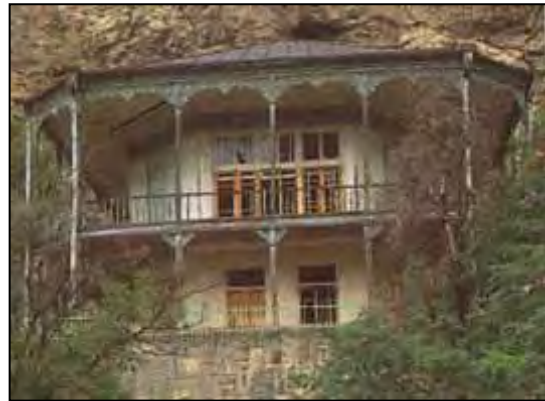
شکل ۵. عمارت کلاه فرنگی