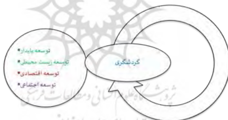
شکل ۷. مدل مفهومی تحقیق

گردشگری شهری بعنوان یکی از بهترین گزینه‌ها توجه به فقر، اشتغال و طرحهای اقتصادی متنوع در کشورهای در حال توسعه در نظر گرفته شده است (Honeck, 2012:1). علاقه شدید به گردشگری شهری از دهه ۱۹۸۰ سبب پیشی گرفتن این نوع گردشگری شده است به طوری که شهرها همواره در طول اعصار و قرون متمادی با توجه به این که کانون قدرت و تصمیم‌گیری بودند لذا در درون خود آستان حوادث و جاذبه‌های تاریخی و فرهنگی بسیاری هستند که امروزه در کانون توجه گردشگران قرار گرفته است (Law, 1993:16). گردشگری شهری موجب ارضای نیازهای فراغتی گردشگران در فضاهای باز درون شهر و محیط پیرامون شهری می‌شود، این نوع گردشگری بسیار پیچیده بوده و به میزان فعالیت‌ها و منبع و توریست واقع در شهر و مقدار بازدید کنندگان از این منابع و فعالیتها اشاره دارد (Lininkanen, 2000:18). گردشگری شهری به طور همزمان هم ظرفیتی عظیم و هم چالشی جدی برای شهرها بحساب می‌آید. ذینفعان شهر این فرصت را شناسایی کرده و تصمیم گرفته‌اند با حفظ توازن بین نیازهای گردشگران و جمعیت محلی از این پتانسیل برای توسعه‌ی شهر استفاده کنند. گردشگری شهری، یکی از مهمترین و پیچیده‌ترین فعالیت‌های فضایی و مکانی انسان در جامعه شهری است، به نظر صاحب‌نظران، جهانگردی شهری یک فرصت بزرگ فرهنگی، اجتماعی و اقتصادی برای شهرها و مادر شهرهای جهانی بوجود می‌آورد، که این فرصت نقش بسیار موثری در ارتقاء کیفیت زندگی شهروندان در ابعاد مختلف می‌تواند ایفاء کند. بنابراین اهمیت گردشگری شهری از نظر اقتصادی و اشتغال‌زایی به حدی است که می‌توان آن به عنوان نیروی محرکه اقتصادی هر محدوده محسوب کرد (Balaguer ۱۸:۲۰۰۲).