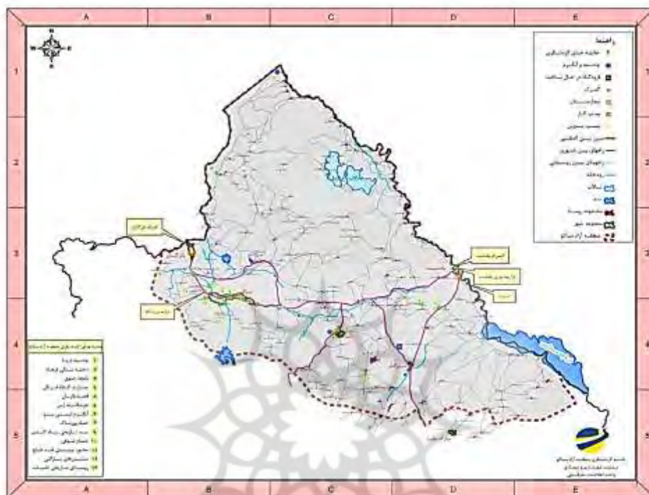
شکل ۲. گردشگری منطقه آزاد ماکو

جاذبه های تاریخی و فرهنگی و هنری: کاخ باغچه جوق، کاخ موزه ماکو، حمام ماکو، ساختمان شهرداری ماکو، پل پنج چشمه، عمارت کلاه فرنگی، بقایای شهر تاریخی بسطام، خانه سنگی جمال خان تیموری و... جاذبه های دینی و مذهبی: کلیسای زور زور، مسجد تاریخی حضرت ابوالفضل معروف به گوی مسجد واقع در زیر بزرگترین کلاهک سنگی جهان، قره کلیسا (طاووس) و... (سایت گردشگری آذربایجان غربی، ۱۳۹۵).