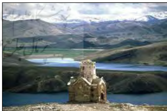
شکل ۳. کلیسای زور زور