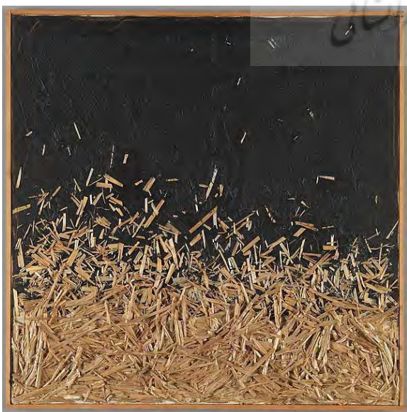
تصویر شماره ۸، مارکو گریگوریان، شب نیمه تابستان شماره ده، کاه خورد شده بر روی بوم، ۵۰.۸*۵۰.۲ سانتی متر، ۱۹۹۱. ( www.Artnet.com )