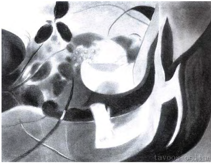
تصویر شماره ۴، جواد حمیدی، ترکیب‌بندی، زغال، ۸۰*۵۰ سانتی‌متر (www.Tavoosonline.com)