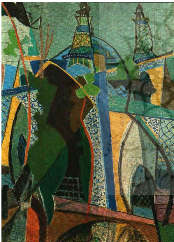
تصویر شماره ۵، جلیل ضیاء‌پور، گلدسته‌های مسجد، رنگ و روغن روی بوم، ۸۵*۶۱ سانتی‌متر، ۱۳۲۸، تهران موزه هنرهای معاصر (کشمیرشکن، ۱۳۹۴، ۶۰)