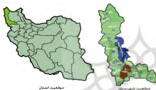
شکل ۳- موقعیت شهرستان مهاباد و استان در کشور (طرح جامع شهر مهاباد، ۱۳۹۵)

مهاباد یکی از شهرهای بزرگ استان آذربایجان غربی می باشد. این شهر در جنوب استان و در دامنه رشته جبال لند شیخان کوهستانی و خوش آب و هوا قرار دارد. مهاباد شهری است که در ساحل شرقی رودخانه مهاباد واقع شده است و امروز به خاطر قرار گرفتن در مرکز تلاقی سه استان آذربایجان شرقی، آذربایجان غربی کردستان از اهمیت خاصی برخوردار است. شهرستان مهاباد یکی از ۱۲ شهرستان تابعه استان آذربایجان غربی است که در محدوده فعلی تقسیمات کشوری خود دارای یک مرکز شهری، ۲ بخش و ۵ دهستان است.