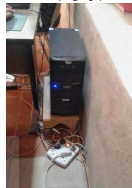
تصویر ۱۹- استفاده از چند راهی برق