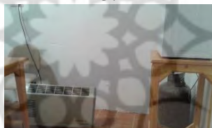
تصویر ۲۲- نگهداری سیلندر اضافه در آبدارخانه