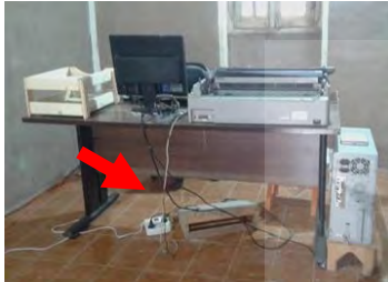
تصویر ۹- نامرتب بودن کابل‌های رایانه