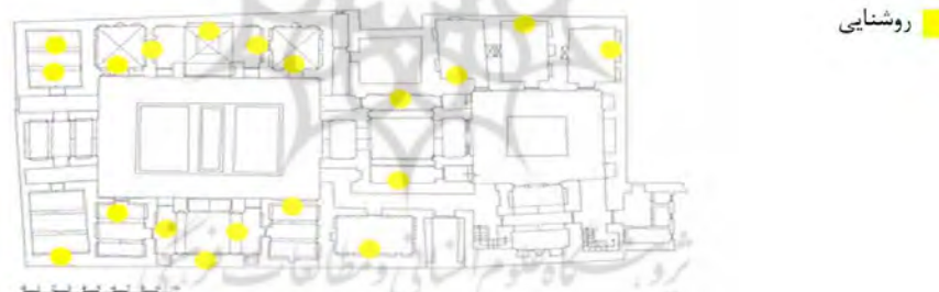
نقشه ۶- جانمایی موقعیت روشنایی ها و نقاط جرقه زنی روی پلان خانه سیستانی