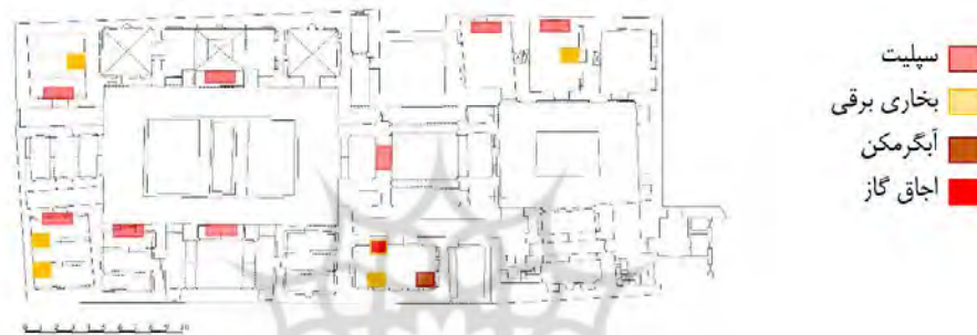
نقشه ۵- جانمایی وسایل گرمایشی روی پلان خانه سیستانی