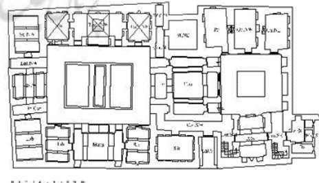
نقشه ۳- پلان خانه سیستانی