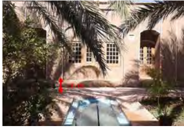
تصویر ۷- نمایش اختلاف سطح