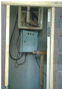
تصویر ۲۱- عدم ساماندهی تابلو برق