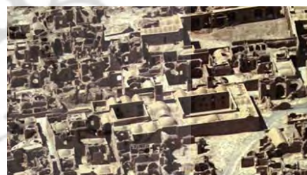
تصویر ۱ و ۲- موقعیت خانه سیستانی روی عکس هوایی