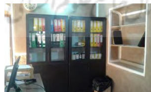
تصویر ۱۰- کمدهای فاقد اتصال ایمن