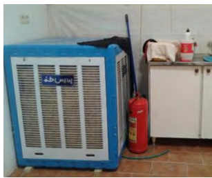
تصویر ۱۸- محل خاموش کننده دستی در آبدار خانه