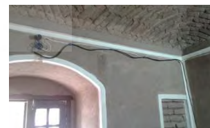
تصویر ۱۱- برق کشی روکار بدون داکت تاسیسات