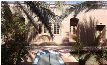
تصویر ۳- بخش اندرونی خانه سیستانی