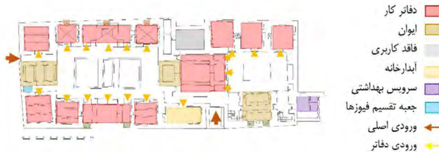
نقشه ۴- جانمایی ورودی ها و کاربری ها روی پلان خانه سیستانی

[۱۱]. ارزیابی خطر حریق را می توان به چهار جزء اصلی تقسیم کرد. آماده سازی، پیشگیری، حفاظت و مدیریت. هیچ استاندارد و یا فرمت ثابتی برای ثبت یافته ها پیرو ارزیابی خطر حریق وجود ندارد [۱۱] الف- آماده سازی: پلان ها و طرح ها ی ساختمان چهارچوب کاری ارزیابی خطر حریق را شکل خواهند داد [۱۱] در پلان خانه سیستانی (پایگاه پژوهشی) مسیرهای خروج، کاربری فضاها، شومینه، بادگیر ها و جعبه تقسیم فیوز ها مشخص شده است.