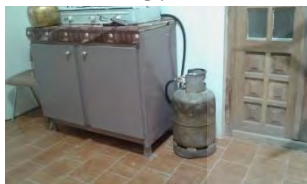
تصویر ۲۳- قرار گیری اجاق گاز بر روی کمد ناپایدار