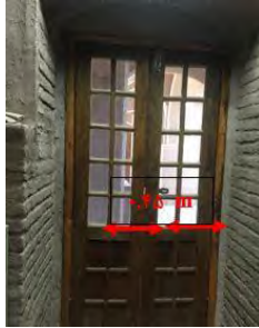
تصویر ۶- نمایش عرض درب ورودی ها