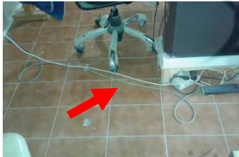
تصویر ۸- نامرتب بودن کابل‌های رایانه