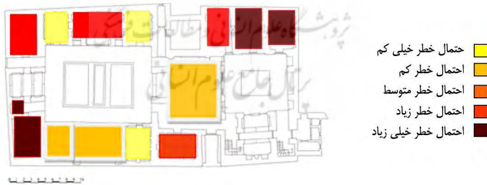
نقشه ۷ - مشخص کردن دفاتر پر خطر بر اساس احتمال خطر آتش سوزی الکتریکی

- مشخص نمودن دفاتر بر اساس میزان احتمال خطر آتش سوزی ناشی از جریان الکتریکی: دفاتر کار بر اساس تعداد وسایل الکتریکی و منبع جرقه زنی مورد امتیاز دهی قرار گرفتند و به چهار گروه: دفاتر با خطر آتش سوزی ناشی از جریان الکتریکی با احتمال کم، متوسط، زیاد و خیلی زیاد تقسیم شدند. تا به تمهیدات لازم جهت کاهش احتمال خطر آتش سوزی ناشی از حریق اندیشیده شود.