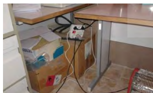
تصویر ۱۴- نگهداری مدارک کنار منبع جرقه زنی