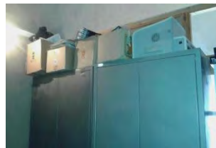
تصویر ۱۳- نگهداری مدارک در