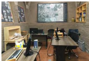
تصویر ۱۶- فاصله نامناسب بین