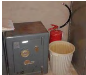
تصویر ۱۷- محل خاموش کننده دستی در بخش حسابداری