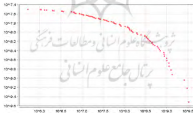
شکل ۱. تابع توزیع استحکام شبکه صادرات در سال ۲۰۱۱