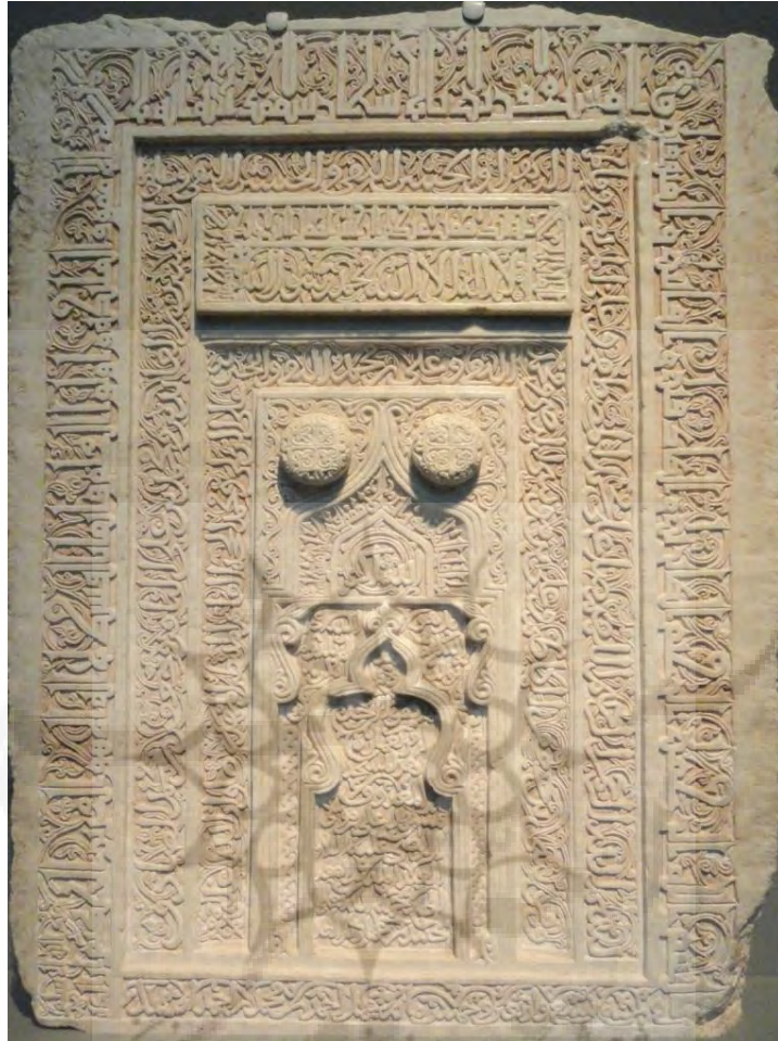
لوح محراب قدمگاه توران پشت محفوظ در گالری فریر واشنگتن

بنا بر بازخوانی قوچانی، متن این لوح که شبیه به محراب مساجد است و احتمالاً همین کارکرد را در بنا داشته، بدین شرح است: در حاشیه اول قسمت‌هایی از آیات ۱۷ تا ۱۹ آل عمران، به خط کوفی این عبارات حجاری شده است: