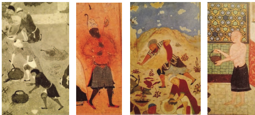
شکل‌های ۷، ۸، ۹ و ۱۰ (به ترتیب: از راست به چپ). نمونه‌هایی از سبک بهزادی؛ تصاویری از توده مردم و مردمانی از لایه‌های میانه‌حال یا فرودست جامعه (مأخذ: Bahari, 1997: 114, 116, 135, 92).

نقاش سبک بهزادی، آنجا هم که اصل شعر به چنین فضایی تعلق ندارد، آن را به سود جهان‌بینی و عقاید مردم‌گرای خود تغییر می‌دهد. نمونه‌ای از چنین استحاله‌ای در نگاره «شیخ مهنا و پیرمرد روستایی» دیده می‌شود که تعبیری مصوّر از حکایت عارفانه منطق الطیر عطار به رخدادی کاملاً عامیانه است. نقاش به شکلی بسیار ظریف به صنف ترازوداران فتوت توجه نموده است، به گونه‌ای که موضوع اصلی داستان به کناری نهاده شده و شخص ترازودار به قهرمان اصلی تصویر مبدل شده است. خواجه ترازودار از شخصیت‌های مهم و مشهور اهل فتوت، و هم‌شان جوانمرد قصاب محسوب می‌شود.