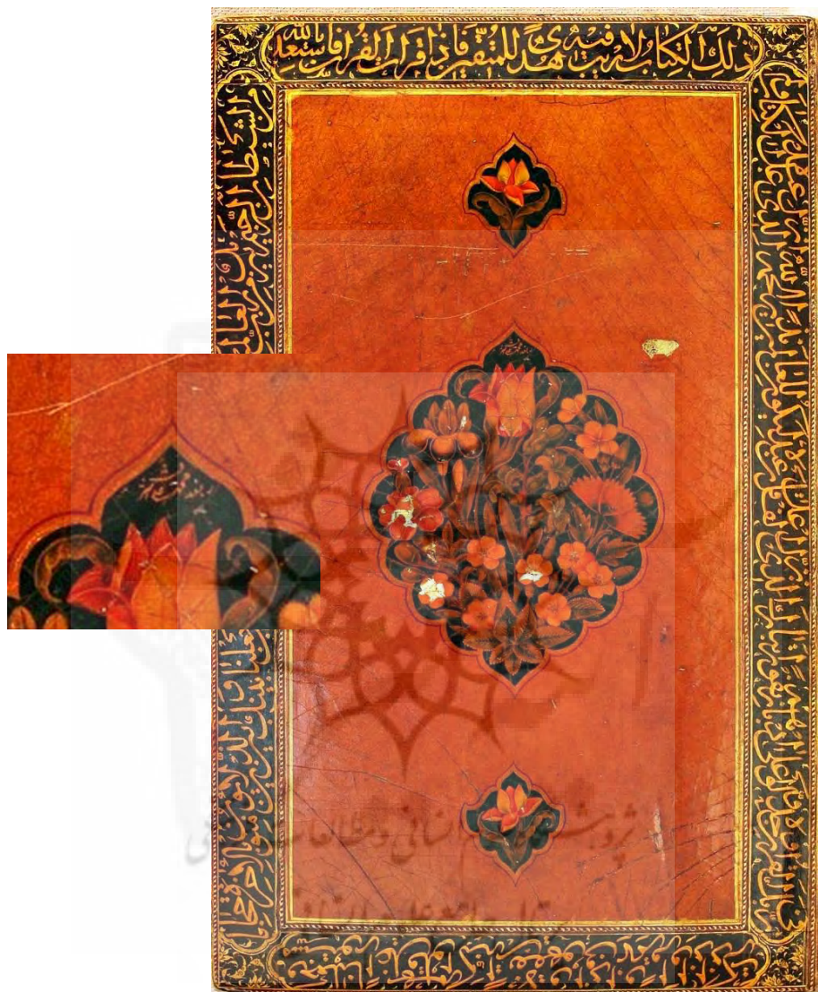
تصویر ۲: ۳ک، لت راست

جلد روغنی قرآن مجید، دوره زندیه، مکتب اصفهان، نقش ترنج و سرترنج با گل و بوته، جلد کار علی اشرف با رقم: «ز بعد محمد، علی اشرفست» به سال ۱۱۶۲، ۱۹۵×۲۷۰.