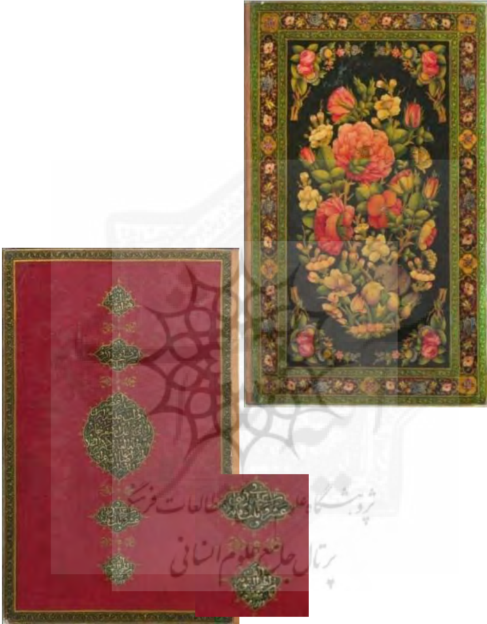
تصاویر ۱-۱-۷ و ۲-۱-۷: ۶۰۳۶ ک، لت چپ و آستر چپ جلد روغنی شرح نهج البلاغه، دوره قاجار، مکتب اصفهان، طرح گل و بوته، جلد: «عمل محمد صادق الامامی»، سال ۱۳۱۲، ۲۱۸ × ۳۵۵.