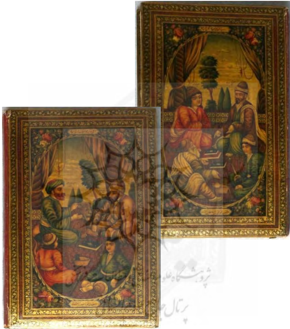
تصاویر ۱-۸ و ۲-۸: ۵۹۶۷ک، لت راست و لت چپ جلد روغنی کلیات سعدی، دوره قاجار، مکتب اصفهان، طرح انسانی؛ لت راست تصویر سعدی در یک مجلس و لت چپ تصویر شیخ بهایی و میرداماد در یک مجلس؛ با رقم محمد تقی بن سلطان الکتاب اصفهانی، سال ۱۳۱۳، ۱۶۲×۲۵۹.