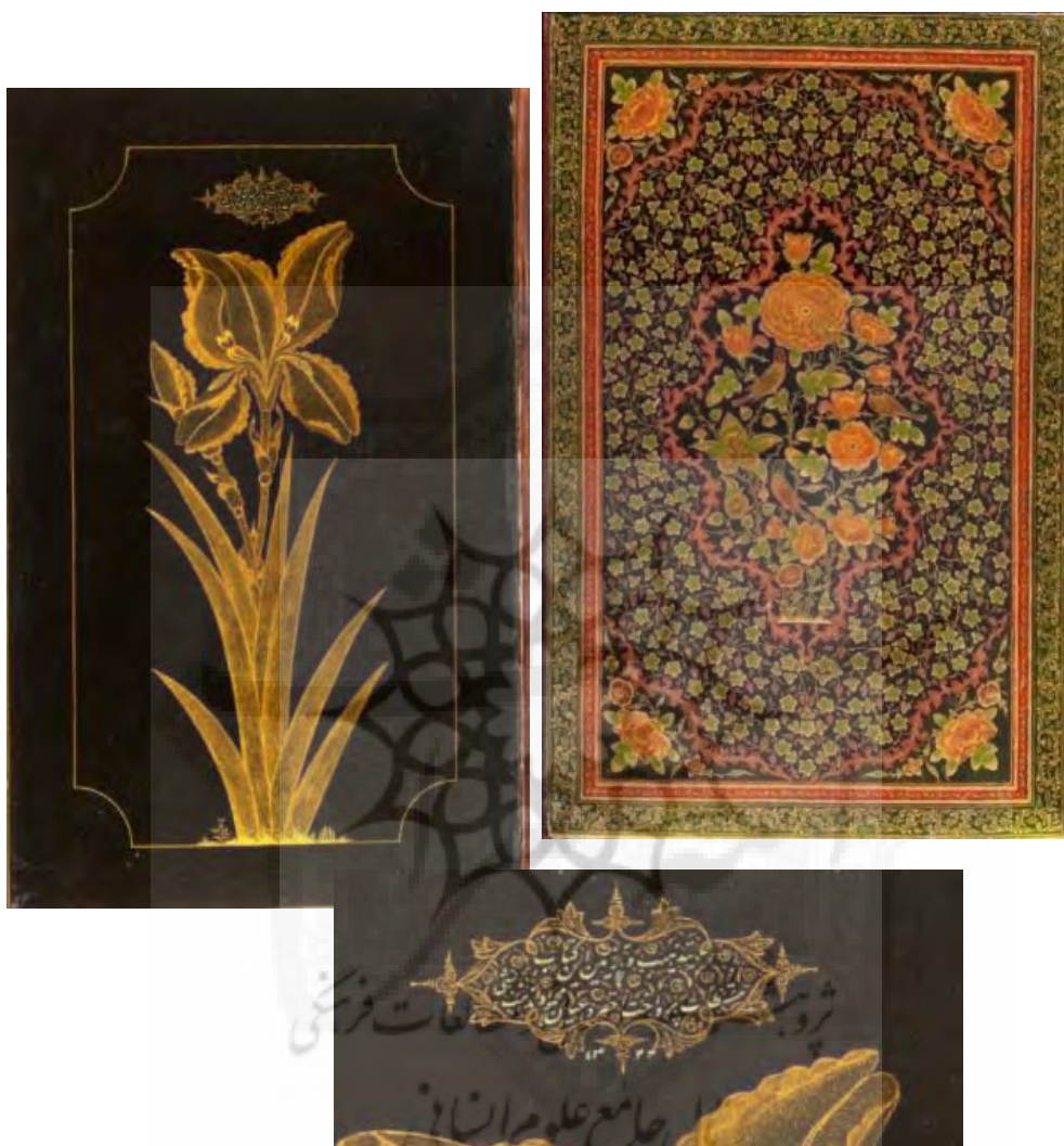
تصاویر ۱-۳-۹ و ۲-۳-۹: ۳۹م، لت چپ و آستر راست جلد روغنی کلیات سعدی، دوره فاجار، مکتب شیراز، طرح لچک ترنج گل و مرغدار بر زمینه گل و برگ خوشه انگوری، آستر تک بوته گل زنبق طلایی بر زمینه مشکی با رقم محمود مذهب باشی، سال ۱۳۲۴، ۲۱۰×۳۱۵.