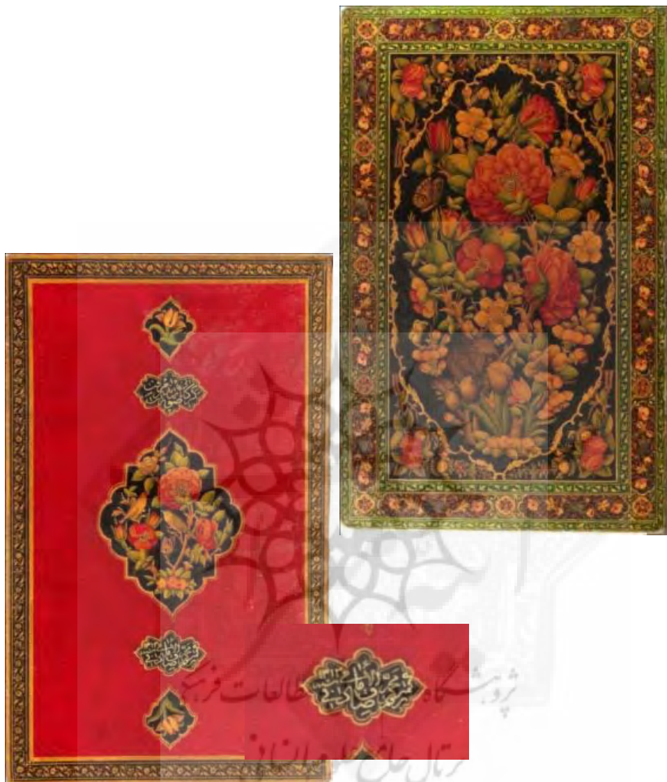
تصاویر ۱-۲-۷ و ۲-۲-۷: ۴۱م، لت راست و آستر چپ جلد روغنی قرآن مجید، دوره قاجار، مکتب اصفهان، طرح گل و بوته، آستر زمینه سرخ ترنج و سرترنج گل و مرغ، جلد با عبارت: «برقم کمترین محمد صادق الامامی»، سال ۱۳۱۳، ۲۱۳×۳۴۳