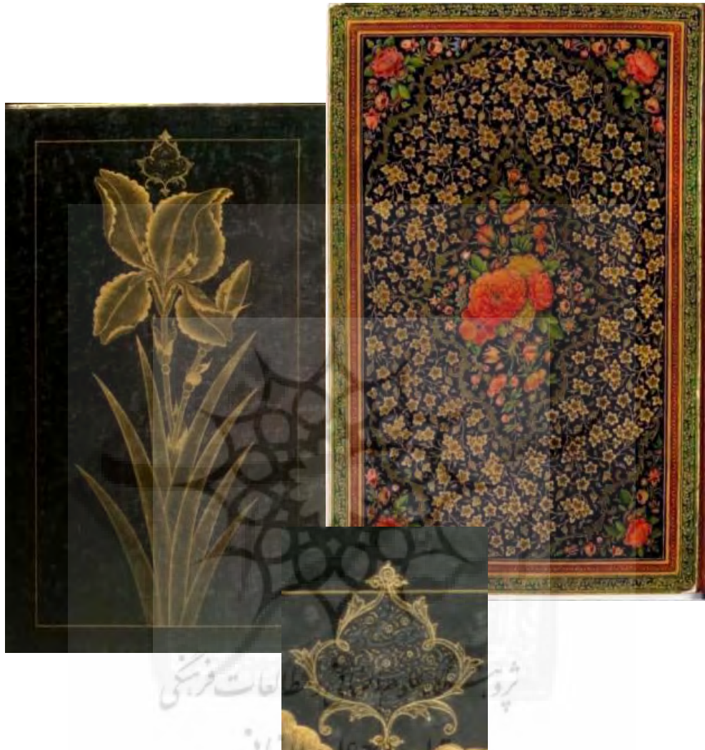
تصاویر ۹-۲-۱ و ۹-۲-۲: ک ۵۹۶۹، لت راست و آستر چپ جلد روغنی دیوان حافظ شیرازی، دوره قاجار، مکتب شیراز، طرح لچک ترنج گل و برگ دار، با عبارت: «رقم احقر عبدالله محمود مذهب باشی شیرازی» در آستر چپ با نقش تک بوته گل زنبق طلایی بر زمینه مشکی، سال ۱۳۱۷، ۱۸۸ × ۲۷۳.