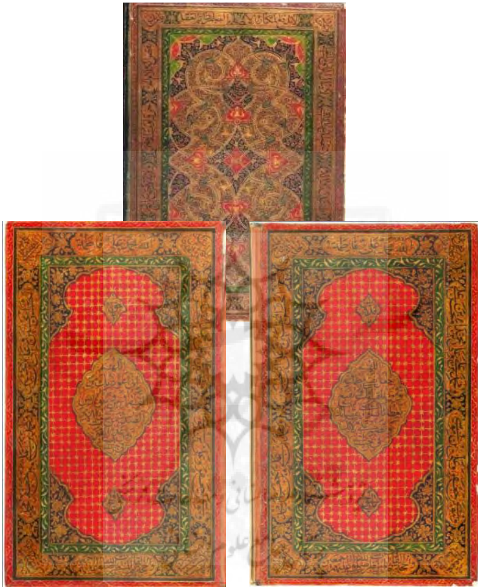
تصاویر ۱-۱۰، ۲-۱۰ و ۳-۱۰: ۴۲م، لت چپ، آستر راست و آستر چپ جلد روغنی قرآن مجید، دوره قاجار، احتمالاً مکتب اردبیل، طرح تذهیبی، آستر لچک ترنج و حاشیه کتیبه‌دار کتیبه و ترنج، آسترها با رقم معصوم‌علی مذهب، سال ۱۳۲۳، ۱۴۳×۲۲۵.