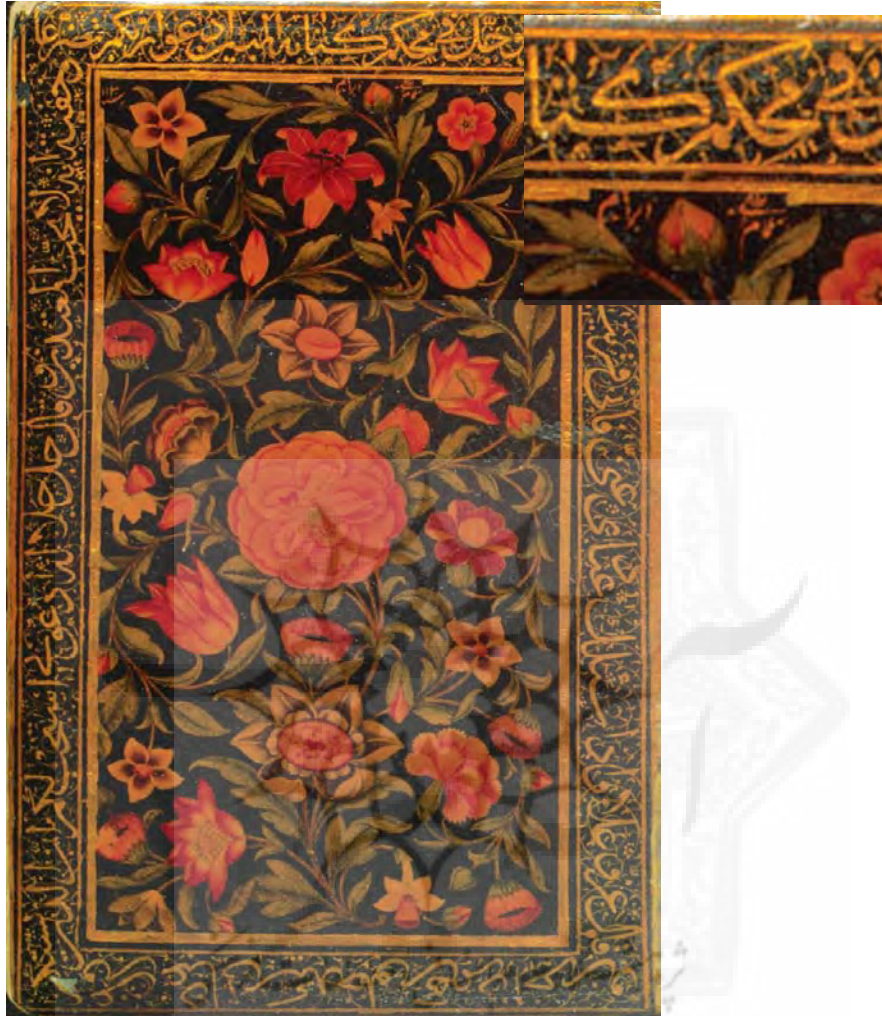
تصویر ۱: ۸۶ک، لت راست جلد روغنی مجموعه، دوره صفوی (متن جلد)، مکتب اصفهان، نقش گل و بوته کار (آقا) ابراهیم، سال ۱۱۳۰، حاشیة دوره قاجار، کتبیبه دار به خط محمد هاشم، سال ۱۲۰۱، ۹۲×۱۴۲.