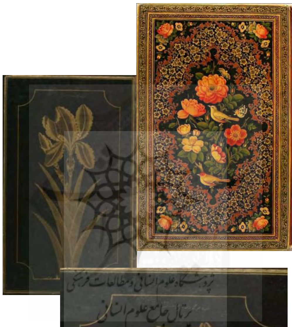
تصاویر ۱-۱-۹ و ۲-۱-۹: ۵۰ک، لت راست و آستر چپ جلد روغنی الدعاء، دوره قاجار، مکتب شیراز، نقش لچک ترنج گل و مرغدار، با رقم: «العبد الاحقر محمود مذهب باشی غفر ذنوبه» در آستر جلد با طرح تک بوته گل زینق طلائی بر زمینه مشکی، سال ۱۳۱۵، ۲۱۵×۱۳۸.