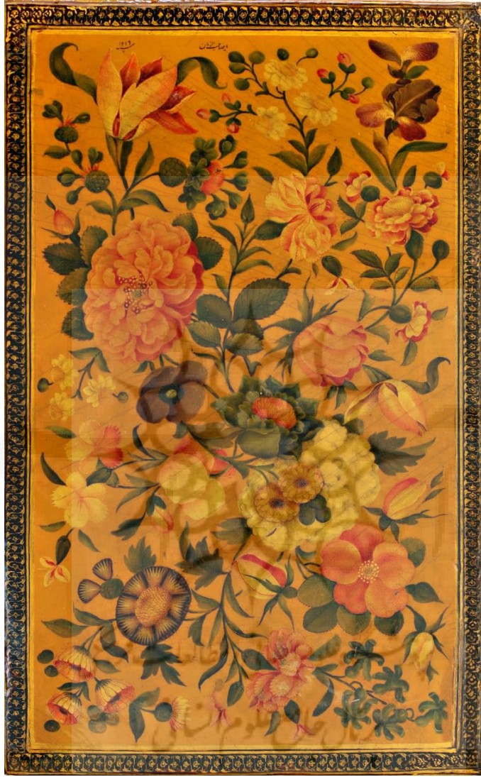
تصویر ۳: ۸۸ک، لت راست جلد روغنی الصحیفه السجادیه، دوره قاجار، مکتب اصفهان، طرح گل و برگ، کار (آقا) زمان با رقم: «یا صاحب الزمان»، سال ۱۲۱۹، ۱۲۷×۱۹۹.