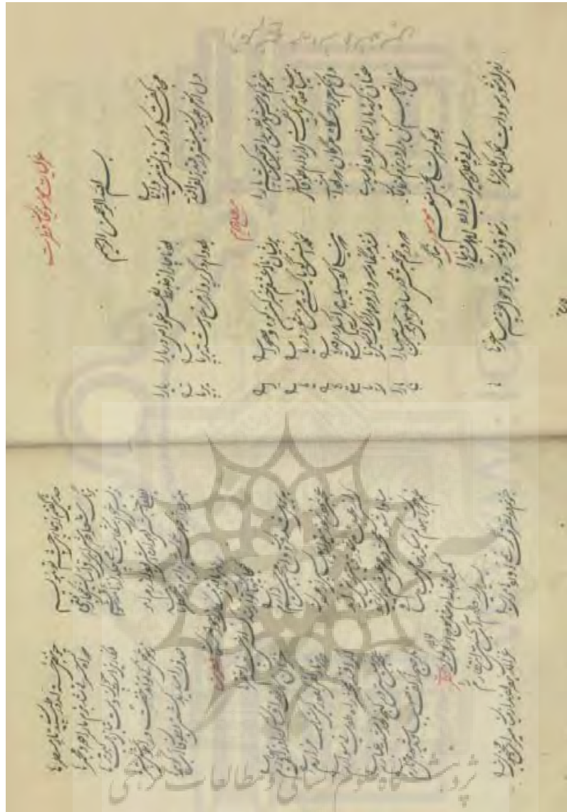
رتال جامع علوم انسانی تصویر برگ نخست غزلیات