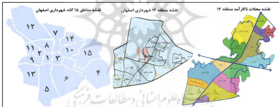
شکل ۱- نحوه قرارگیری منطقه ۱۴ در شهر اصفهان

و قلب زیارتی شهر به شمار می‌آید. این محدوده با سابقه تاریخی در سکونت، فعالیت کشاورزی و مذهبی در کنار شهر قدیم اصفهان به وجود آمده؛ که در دهه‌های ۴۰-۵۰، با جایگزین شدن زمین‌های کشاورزی به وسیله خانه‌های مسکونی با بافت نامنظم به ساختار شهر اصفهان پیوند خورده و به بخشی از محلات اصفهان تبدیل گشته است. این رشد سکونتگاهی با ساخت و سازهای پراکنده و کم‌دوام در طول سال‌های انقلاب و بعد از آن، به دلیل رشد مهاجرت به اصفهان که ناشی از پیامدهای جنگ با ورود افغان‌ها، اعراب و افراد غیربومی استان‌های دیگر می‌باشد، موجب ناکارآمدی در بافت گردید. در این منطقه یکی از وسیع‌ترین و پرجمعیت‌ترین مناطق بافت ناکارآمد در شهر اصفهان است که ناکارآمدی این بافت، زمینه‌ساز پیدایش مسائل و مشکلات بسیار کالبدی، اقتصادی، اجتماعی، زیست‌محیطی در منطقه شده است. از این رو، در این پژوهش برای بازآفرینی پایدار آن به بررسی عوامل کلیدی مؤثر در این منطقه پرداخته شده است.