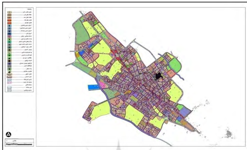
شکل ۲- نقشه کاربری‌های شهر آباده

با توجه به جدول ۳، در اغلب کاربری‌های بااهمیت برای مشارکت نوجوانان در شهر آباده، کمبود زیادی در سرانه‌ها مشاهده می‌شود که بیشترین کمبود مربوط به کاربری ورزشی بوده و کاربری‌های پارک و فضاهای تفریحی و فرهنگی در رتبه‌های بعدی از نظر کمبود قرار دارند.