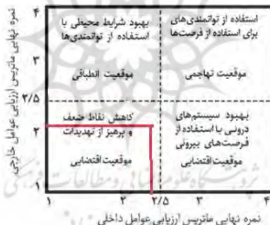
شکل ۳- ماتریس داخلی - خارجی ناشی از مدل سوات در شهر آباد

امتیازات جداول ۸ و ۹ نشانگر آن است که امتیازات نقاط قوت (۱/۸۱) بیشتر از ضعف (۰/۶۵) و همچنین فرصت‌ها (۱/۰۶) بیشتر از تهدیدات (۰/۹۸) است ولی این ارجحیت چندان برای این شهر موقعیت مناسبی را ایجاد نمی‌کند. با انتقال امتیازات نهایی کسب‌شده از عوامل داخلی و خارجی، با توجه به شکل ۴، مشاهده می‌گردد که امتیازات در ربع سوم محور مختصات واقع شده که نشان‌دهنده موقعیت اقتضایی است. این موقعیت در نتیجه اینکه هم عوامل داخلی و هم خارجی از امتیاز ۲,۵ کمتر بوده‌اند، روی نمودار ایجاد شده است که بیانگر استراتژی‌های WT یا تدافعی می‌باشد. هدف در اجرای استراتژی‌های WT کم کردن نقاط ضعف داخلی و پرهیز از تهدیدات ناشی از محیط خارجی است. در چنین موقعیتی وضعیت تقریباً نامناسب بوده و باید سعی نمود که با اقداماتی از چنین وضعیتی پرهیز نمود.