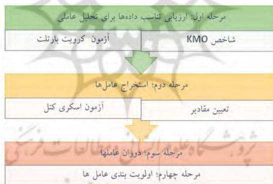
شکل ۱- مراحل انجام تحلیل عاملی

که در آن: W بیانگر ضرایب نمره عوامل و P معرف تعداد متغیرهاست. مبانی ریاضی تحلیل عاملی، برحسب مقدار و نوع واریانس هر متغیر X_i که توسط عامل‌های موجود در مدل توجیه می‌شود، متفاوت است (اصفهانی، ۱۳۹۶).