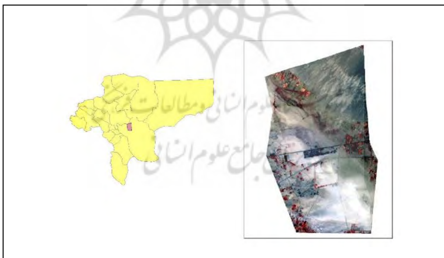
شکل ۱. محدوده مورد مطالعه نقشه

کاربری‌های منطقه مورد مطالعه عبارتند از: اراضی کشاورزی آبی، اراضی شوره زار که عمدتاً دستخوش رسوبات فرسایش یافته بادی است، اراضی مسکونی، صنعتی و تعدادی کوره‌های آجرپزی و گچ پزی و همچنین معادن شن و ماسه.