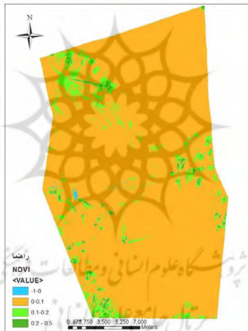
شکل ۳. نقشه پوشش گیاهی حاصل از شاخص NDVI

با بررسی های انجام شده توسط مطالعات سازمان جنگلها و مراتع کشور (پراکنش گیاهان دارویی استان اصفهان)، همچنین نقشه تیپ گیاهی در منطقه سگری بیشترین پراکنش گیاهان دارویی خارشتر ایرانی است.