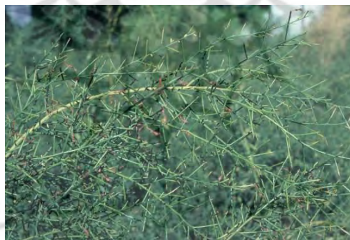
شکل ۴. تصویر خارشتر

کلمی است. شاخه‌های این گیاه خمیده و نسبتاً محکم است. ارتفاع ۲۰ تا ۱۲۰ سانتی‌متر و دارای شاخه‌های متعدد خاردار به‌رنگ سبز است طول خارها، از ۱ تا ۶ سانتی‌متر متغیر بوده و زاویه آنها، تقریباً راست است. خارشتر در اقلیم فراخشک، خشک بیابانی سرد قرار دارد. رویشگاه‌های این گونه با میانگین بارندگی سالانه ۱۱۳.۵ میلی‌متر و میانگین دمای سالانه ۱۷ درجه سانتی‌گراد گزارش شده است. این گیاه خاصیت دارویی به خصوص در دفع سنگ کلیه دارد. ریشه این گیاه خیلی عمیق است و تا ۵-۶ متر هم می‌رسد و از این لحاظ در مقابل کم‌آبی مقاومت زیاد دارد (قهرمان، ۱۳۷۳). در ضمن عامل اصلی تکثیر و توسعه این گونه، ریزوم است. از این گیاه علاوه بر ترنجبین عرق موسوم به عرق خارشتر نیز تهیه می‌کنند. ترنجبین در تسکین سرفه و درد سینه و نیز تسکین عطش و تب موثر است. عرق خارشتر نیز درمان‌کننده کلیه و مجاری ادرار و دفع‌کننده سنگ کلیه و مثانه است (زرگری، ۱۳۷۲)