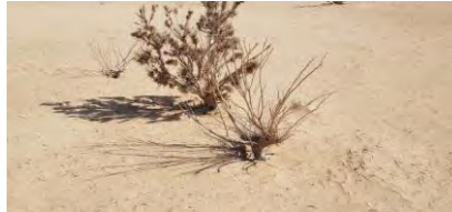
شکل ۶. وضعیت پوشش در منطقه مورد مطالعه