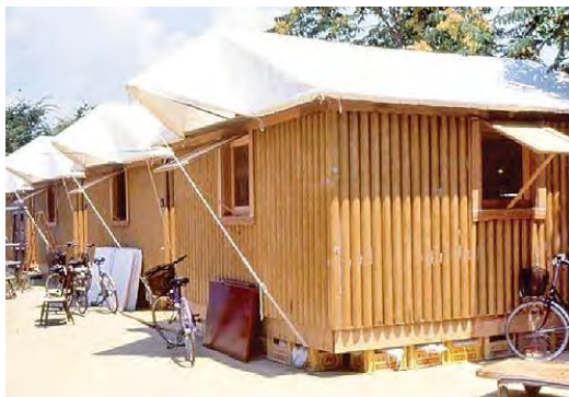
تصویر ۲- طرح پیشنهادی شیگروین (سایت اینترنتی آرک دلی)

مربع را می پوشاند. هر مدول متشکل از یک چادر نیمه مخروطی می باشد که در مرکز به یک حلقه کششی فولادی به قطر ۳/۹۶ متر متصل می گردد و در اطراف به کابل های پیرامونی مهار شده و در چهار گوشه به نیمه ارتفاع ستون های نگه دارنده سازه متصل می شود. در "تصویر ۳" تصویری از این فرودگاه دیده می شود. حلقه کششی مرکزی بوسیله کابل های مضاعف به بالای هر یک از ستون های تکیه گاهی آویزان شده اند. یک سازه غشایی برای پوشش سقف این فرودگاه استفاده و به وسیله لایه ای از تفلون پوشیده شد که تقریباً ۷۰ درصد اشعه خورشید را بازتاب می دهد. پارچه این سازه به خاطر جنس تفلون ۱۹ آن و گرد و غبار محیط قابل شستشو است و این فضای مسقف پارچه ای در حقیقت محوطه بازی است که به وسیله چادر پوشیده شده و جریان هوا به خوبی در آن برقرار می شود و از حرارت بالای صحرا عربستان کم می کند. پوسته فایبرگلاس ۲۰ با پوشش تفلون برای عمر مفید ۲۰ ساله در نظر گرفته شده است. (صامتی ۱۳۹۴)