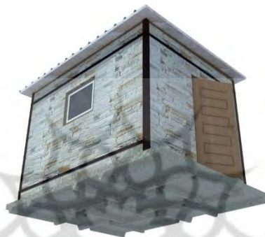
تصویر ۵- اجزای سقف و کف سرپناه

در این نمونه از بلوک‌های بتن گازی ۲۱ (مانند هبلکس) برای ساخت سازه سرپناه استفاده شده است. به دلیل داشتن وزن کم و استفاده از ملات مخصوص آن که به سادگی قابل اجراست، همچنین ویژگی عایق حرارتی و صوتی و قیمت مناسب آن، این بلوک‌ها برای ساخت اسکان انتخاب شد. از صفحات بتن مسلح با ابعاد کوچک برای ساخت کف و پایه‌ها (پی سازه‌ای و کف معماری) بهره برده