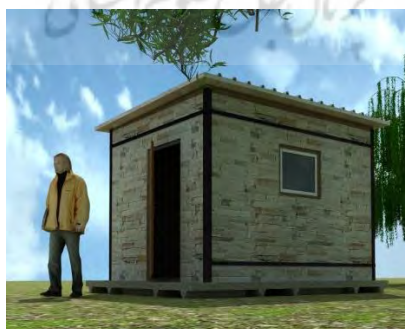
تصویر ۴- نمونه اولیه پیشنهادی