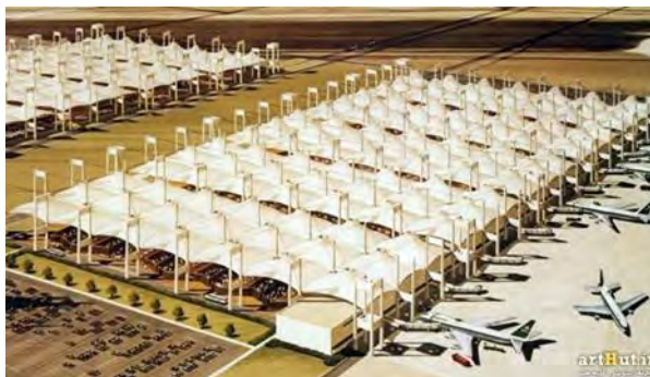
تصویر ۳- فرودگاه بین‌المللی ملک عبدالعزیز