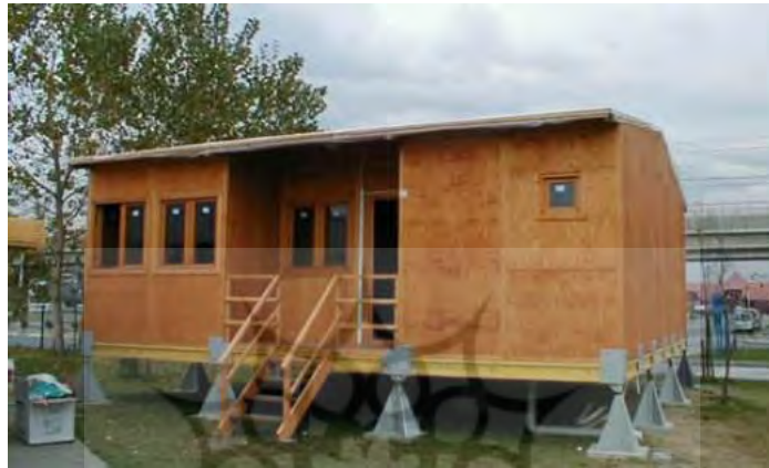
تصویر ۱- یک نمونه از طرح اولیه ساخته شده (سنر و آلتون ۲۰۰۹)

یک نمونه اولیه از واحد سرپناه موقت (Sener and Altun 2009) پس از سانحه، توسط سازمان عناصر پیش‌ساخته و مرکز تولید مبلمان شهری شهرداری کلانشهر استانبول ساخته شده است. با توجه به قابلیت‌های تکنولوژیکی و امکانات تاسیسات تولیدی، قبل از تولید، تغییراتی در پروژه نمونه اولیه