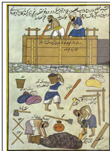
تصویر ۵- ساخت دیوارهای گلی ۱۲۳۹-۱۲۲۹ ه.ق.

معماران سنتی، پس از انتخاب خاک مناسب، آماده‌سازی گل را که شامل مراحل عمل‌آوری، ورز دادن و افکندن گل بوده، یکی از مراحل مهم