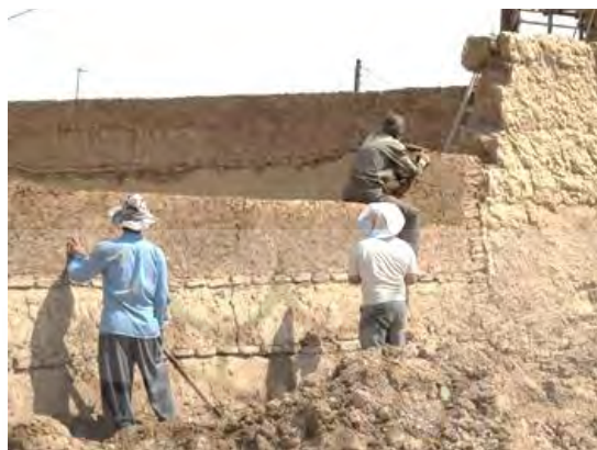
تصویر ۷- اجرای چینه، حصار شهر تاریخی بشرویه، خراسان جنوبی

باشد. موج‌ها و انحناهایی که به دیوارهای چینه‌ای داده می‌شود موجب قوی‌تر شدن آن می‌شود (وارن، ۱۳۸۷: ۶۳). علاوه بر این، به موجب ابعاد بزرگ‌تر گل چینه در مقایسه با گل خشت در هنگام افکندن، شدت فشار وارده بر گل نیز بیشتر بوده و تثبیت مکانیکی با توان بیشتر اعمال می‌شود.