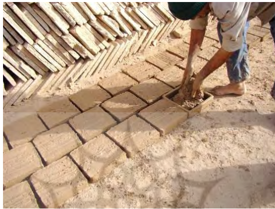
تصویر ۶- تولید خشت در کارگاه مسجد جامع میبد، یزد

خشت‌مال قالب را روی زمین گذارده و به اندازه مورد نیاز گل را با دو دست، برش داده و سپس پنجه کش نموده و با ضرب در وسط قالب می‌کوبد. در این مرحله سعی می‌شود با فشار دست، تمامی قالب به‌ویژه گوشه‌های آن پر شود. این عمل سبب وجود آمدن خشتی با حجمی فشرده و بدون فضای خالی و متخلخل می‌شود. سپس خشت‌مال