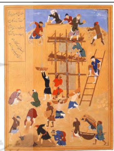
تصویر ۳- ساخت کاخ خورنق در عصر ساسانی