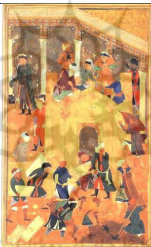
تصویر ۴- نگاره ای از بهزاد ۸۶۶-۸۵۹ ه.ق.