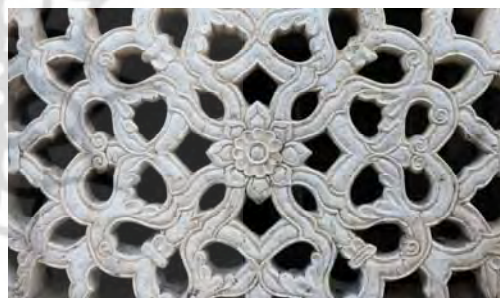
تصویر ۸- نقوش طبیعی، مبین حضور طبیعت به صورت نمادین در معماری

یا حضور نور در مرکز گنبد اشاره داشت. در شکل دوم، رویکرد نمادین به طبیعت از طریق کشف و تربیت عناصر پنهان طبیعت برای حضور در معماری تحقق می‌یابد و معمار از این طریق آنچه را که طبیعت بدان نیازمند است در قالب معماری بدان می‌بخشد، از این موارد می‌توان به حضور آب و فضای سبز در سکونتگاه‌های کویری اشاره داشت. شکل سومی نیز برای حضور نمادین طبیعت در معماری وجود دارد که این امر حضور انتزاع شده طبیعت در معماری است. در این حالت عناصر طبیعی به حالت انتزاعی شده، در معماری حضور می‌یابند. در اینجا طبیعت انسانی شده نمادی بر یک امر اعتقادی یا فرهنگی است. از آن جمله می‌توان به هندسه یا آرایه بندی‌های معماری اسلامی - ایرانی اشاره کرد.