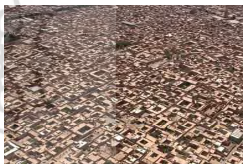
تصویر ۷- تکرار دانه‌های به ظاهر مشابه در حالی که هیچ یک از بناها شبیه هم نیستند، تنوع منحصر به فردی را در معماری و شهرسازی ایران موجب شده است.

ب-۱-۴- تکرار و تنوع: در طبیعت در مقیاس کلی یک الگو تکرار می‌شود، لیکن در مقیاس جزئیات این الگوی کلی یک بار هم تکرار نمی‌گردد. معماری ملهم از طبیعت، نیز باید این خصلت را داشته باشد. بدین معنا که بنای طبیعی دارای همان تعادل بین تکرار و تنوع است، به نحوی که برای مثال در بافت‌های تاریخی شهرهای تاریخی ایران در عین تداعی یک تکرار در سطح کلان هیچ دو بنایی عیناً مشابه یکدیگر نیستند.