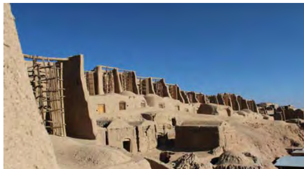
تصویر ۵ و ۶- طبیعت در مقام بستر تشکیل معماری تأثیرات بسیاری را بر سازمان معماری مناطق مختلف داشته است.