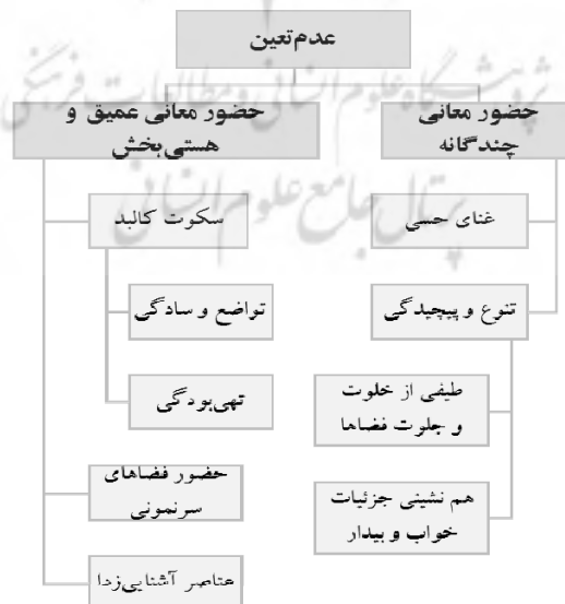
نمودار ۳- عوامل مؤثر بر عدم تعیین در مسکن