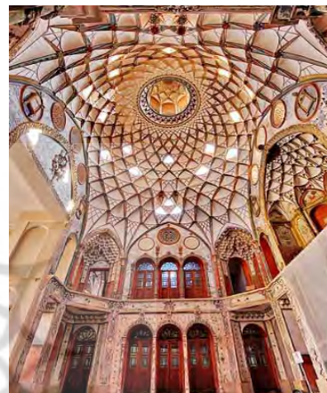
تصویر ۳- آسمانه‌ای از جنس نور (شکستن الگوی ذهنی سقف)

انعکاس بنا در حوض‌خانه‌ی ایرانی نمونه‌ای از کاربرد هم‌افزا و ارزش‌زای این شگرد است. انعکاس تصویر بنا در آب حوض نه تنها آن را از زاویه‌ای دیگر می‌نماید، بلکه با تغییر دائمی که در