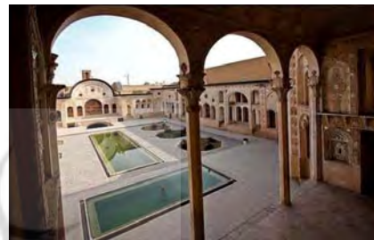
تصویر ۱- پیچیدگی در جزئیات و تعین کلیات در خانه سنتی.

می‌کند، ذخیره‌ی اطلاعاتی برای مراجعات بعدی ساکن را نیز فراهم آورد. پس هم یک الگوی کلی در ذهن مخاطب می‌سازد و هم تکمیل آن را منوط به بازدیدن و استفاده‌های بعدی می‌کند. چنین شبکه‌ای در خانه سستی قابل درک است. در حالی که تنوع و پیچیدگی فضاها و جزئیات رازآمیزی خانه را موجب می‌شوند هندسه‌ی کلی حیاط مرکزی، تعین و قاعده‌مندی را موجب شده، از آشفتگی کلیات جلوگیری می‌کند و موجب خوانایی آن می‌گردد.