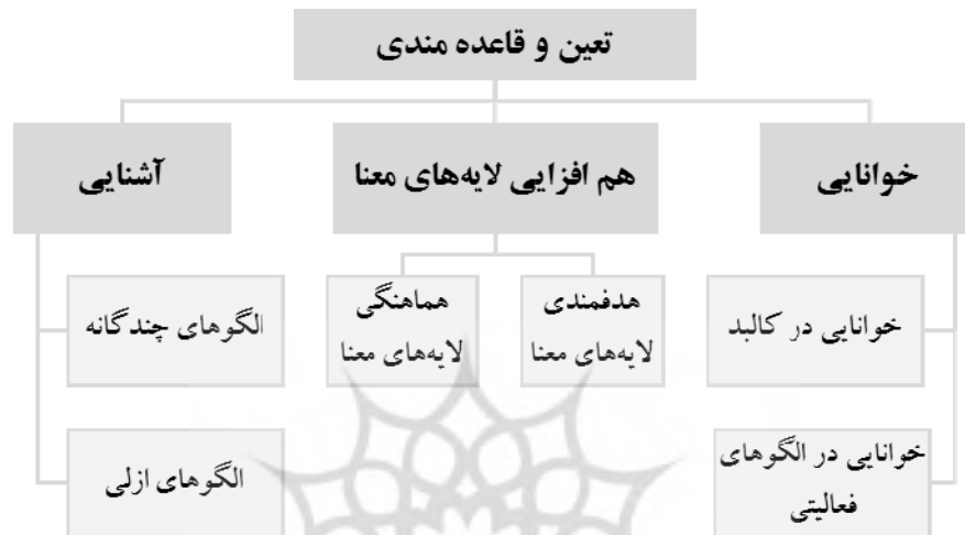
نمودار ۲- عوامل مؤثر بر تعین و قاعده مندی مسکن

و دیگران، ۱۳۸۸: ۴۰). در این حالت، خانه پرورنده‌ی آدمی برای به دنیا آمدن و متولد شدن است و نه قفسی برای اسیر کردن او، دارای تجربه‌ای فضایی است که حال آدمی را تعالی می‌بخشد، اگرچه معنایش به زبان نیاید. از این رو شایسته است معانی سطحی مسکن چون عملکرد و فرم از سلطه‌ی