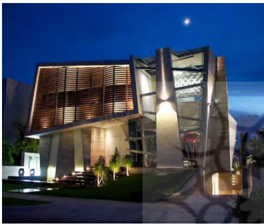
تصویر ۴- خانه‌ای به سبک دیکنستر اکشن با احجام دگرگون شده

کیفیت آب و تحرک آن وجود دارد چهره‌ای همواره لغزان و ناپایدار را به نمایش می‌گذارد که علاوه بر متغیر و پیش‌بینی‌ناپذیر کردن فضا، حضور ناپایدار عالم ماده را به مخاطبان گوشزد می‌کند و حساسیت‌های معنوی را در انسان بیدار می‌سازد. چنین معماری‌ای شاید از نظر فرمی هیجان‌انگیز نباشد، اما به طور مرموز و فراگیری دیرآشناست؛ چراکه ما خود نیز این گونه‌ایم، موجودی برزخی از جسم و روح.