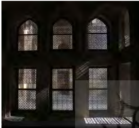
تصویر ۲- نیستی کالبد خانه سستی- کالبد زمخت و سنگین در برخورد با نور راوی پیروزی هستی است.

معناست. سوم آن که چنین فضایی آمیخته با ماده و معنویت که در آن معنویت غالب است به راستی نمودی از ساکن است و می‌تواند پذیرای خوانش ابعاد مختلف وجودی وی باشد؛ چرا که انسان خود نیز این گونه است؛ موجودی برزخی از جسم و روح که زندگانی اش در طول خویش، هجرتی از ماده به معنویت است (حسن‌زاده، ۱۳۸۶: ۵۶ و ۵۷).