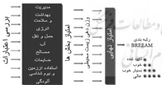
تصویر ۳- فرایند امتیازدهی در سیستم BREEAM (Alnaser, 2008, 2039)

بنابراین در روش‌های امتیازدهی زیست‌محیطی برای مناطق مختلف، سیستم‌های توزین یک عنصر کلیدی در تخصیص امتیاز به اعتبار تلقی می‌شوند.