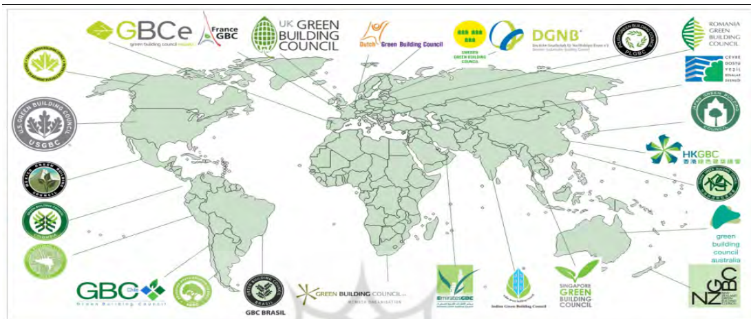
تصویر ۱- نشان‌های شوراهای ساختمان‌سازی سبز در کشورها

و CASBEE (مورد استفاده در کشور ژاپن) با توجه خاص به حوزه تخصیص اعتبار (سیستم‌های توزین و امتیازات) و معیارهای توسعه پایدار در هر سیستم، به بررسی و مقایسه تطبیقی آن‌ها پرداخته شده است و در ادامه به شناسایی زمینه‌های