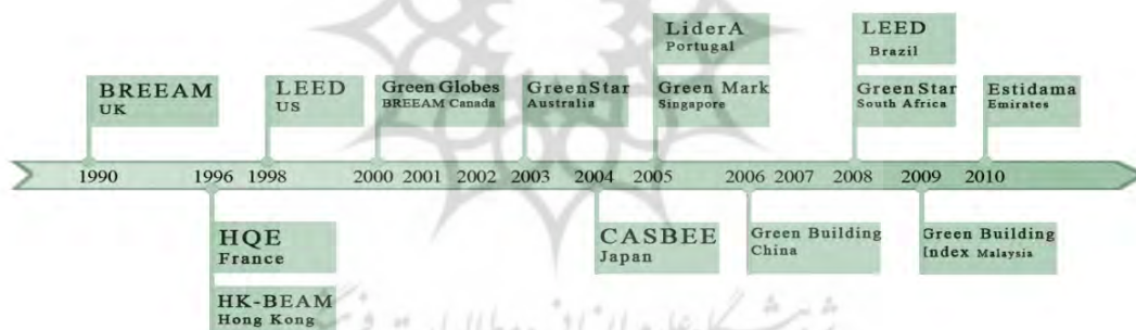
تصویر ۲- روند تدوین سیستم‌های امتیازدهی زیست محیطی ساختمان (Reed et al, 2009, 9; Papargyropoulou, 2012, 46)

در روند امتیازدهی درج می‌گردد و در ارزیابی نهایی ساختمان، جمع امتیازات کل سطح گواهینامه را به صورت زیر مشخص می‌کند. نتایج امتیازدهی این سیستم با ارائه گواهینامه‌ای در یکی از سطح‌های زیر است: - تأیید شده یا PASS (۳۰-۴۵ درصد امتیاز) - خوب یا GOOD (۴۵-۵۵ درصد) - بسیار خوب یا VERY GOOD (۵۵-۷۰ درصد)